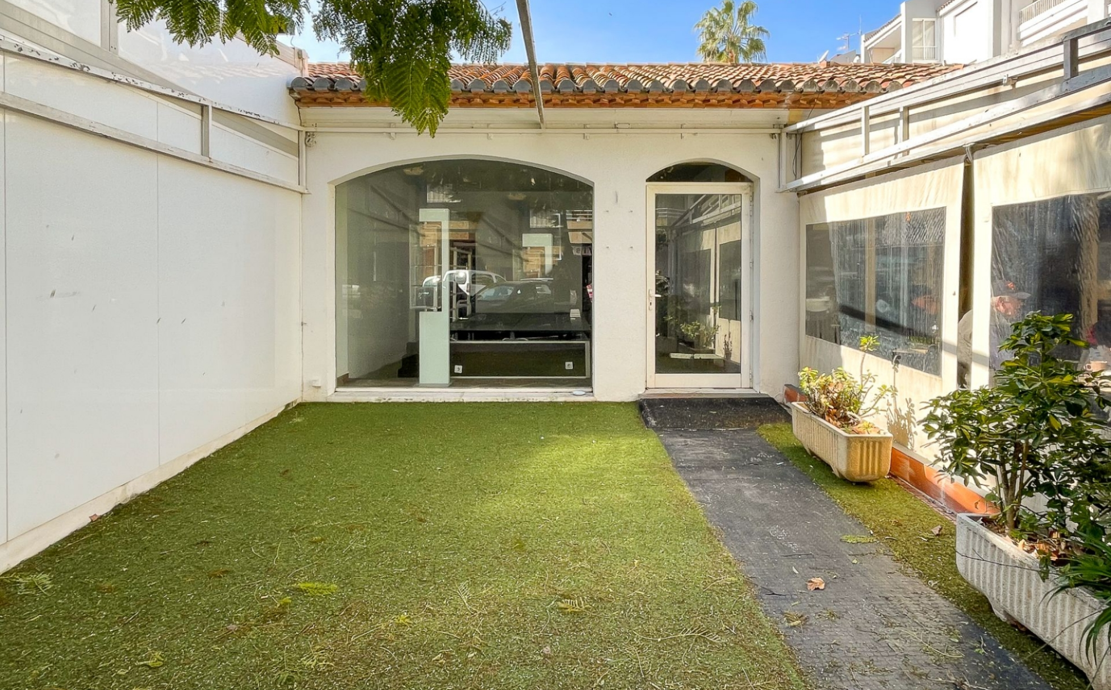
Local comercial con terraza en el puerto de Jávea PUERTO, JÁVEA/XÀBIA - REF. LC-103