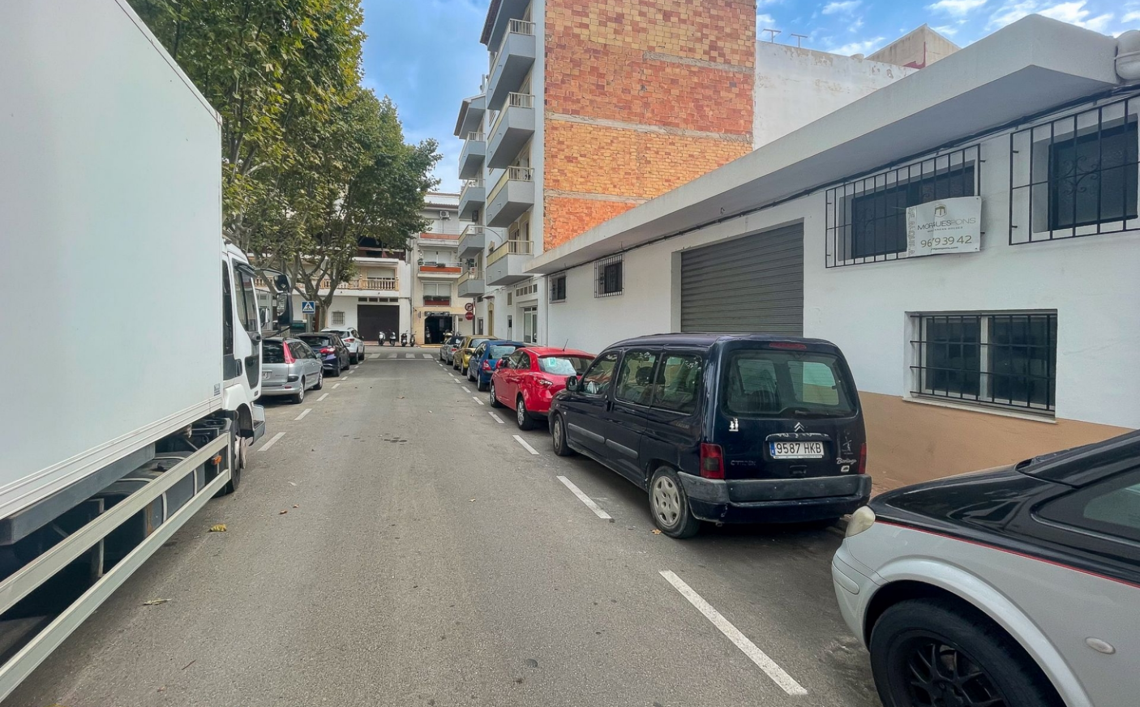
Local comercial en alquiler Jávea CENTRO CIUDAD, JÁVEA/XÀBIA - REF. LC-116