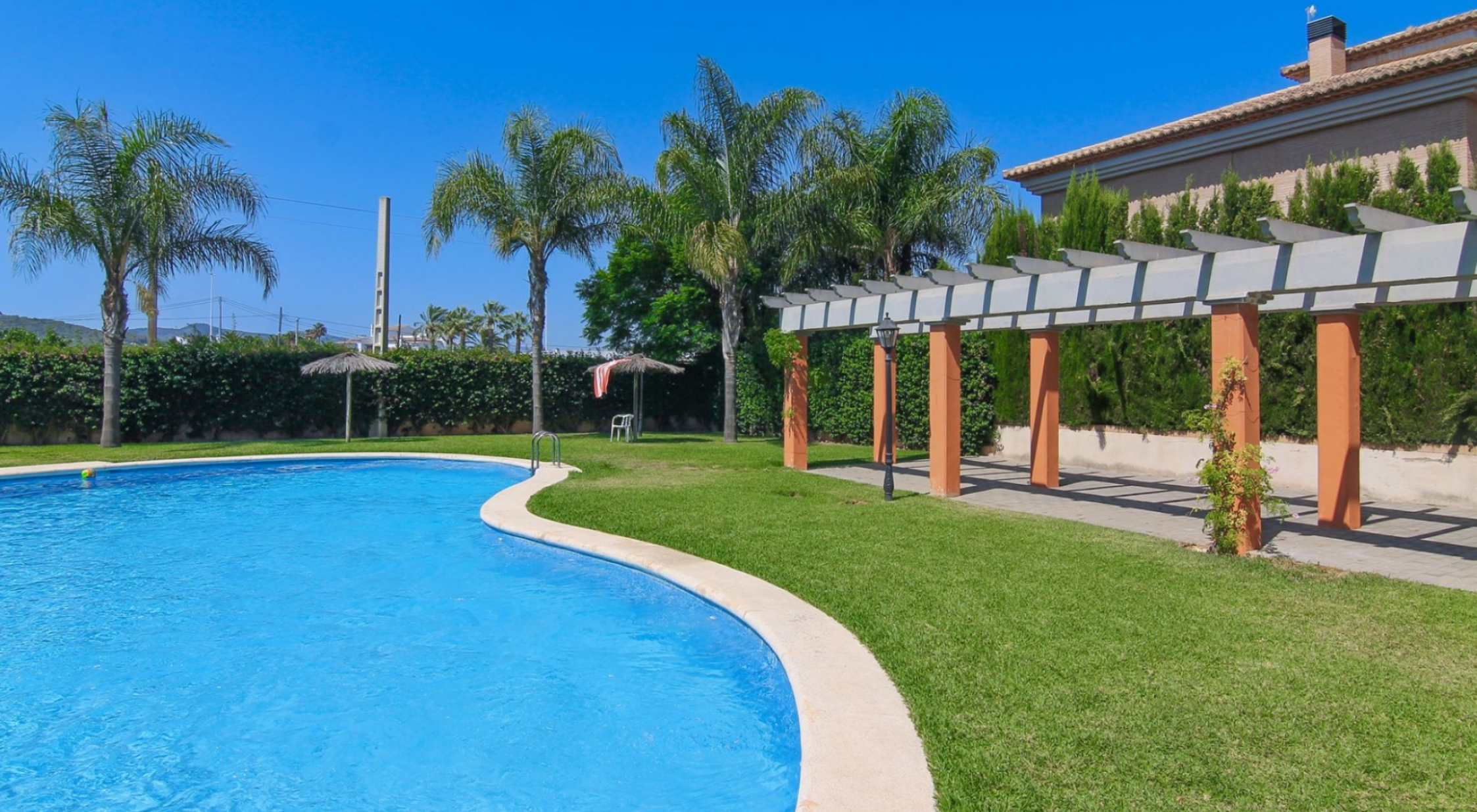
Planta baja junto a la playa del primer montañar en Jávea MONTAÑAR - EL ARENAL, JÁVEA/XÀBIA - REF. A-670