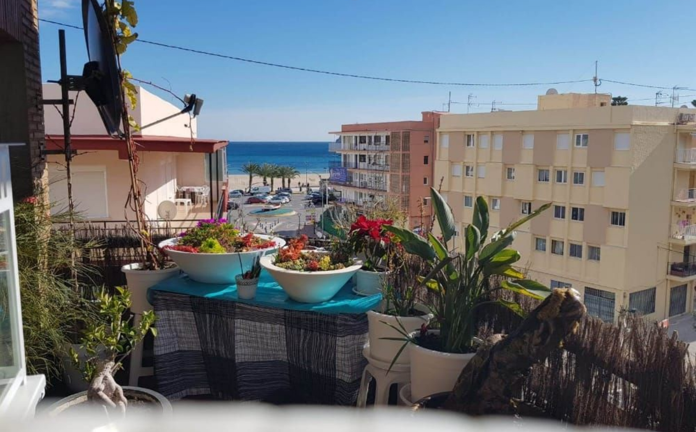
Dachgeschosswohnung in Playa del Arenal. MONTAÑAR - EL ARENAL, JÁVEA/XÀBIA - REF. A-359