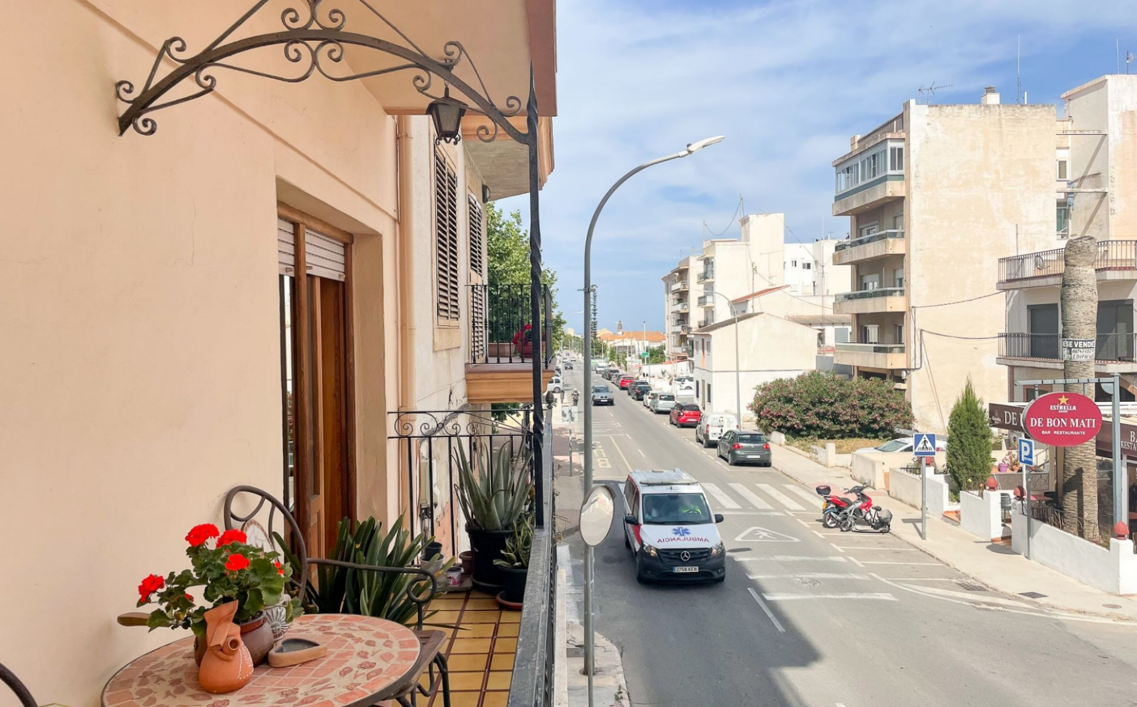
Dreizimmerwohnung mit Aufzug im Zentrum von Jávea ALTSTADTZENTRUM, JÁVEA/XÀBIA - REF. A-345