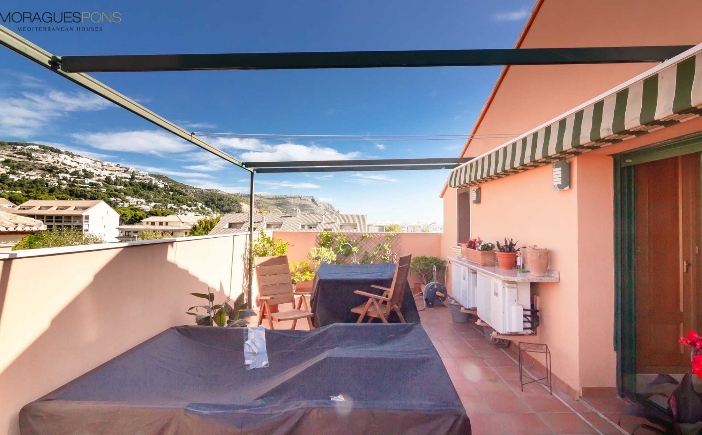
Duplex-Penthouse im Hafen von Jávea