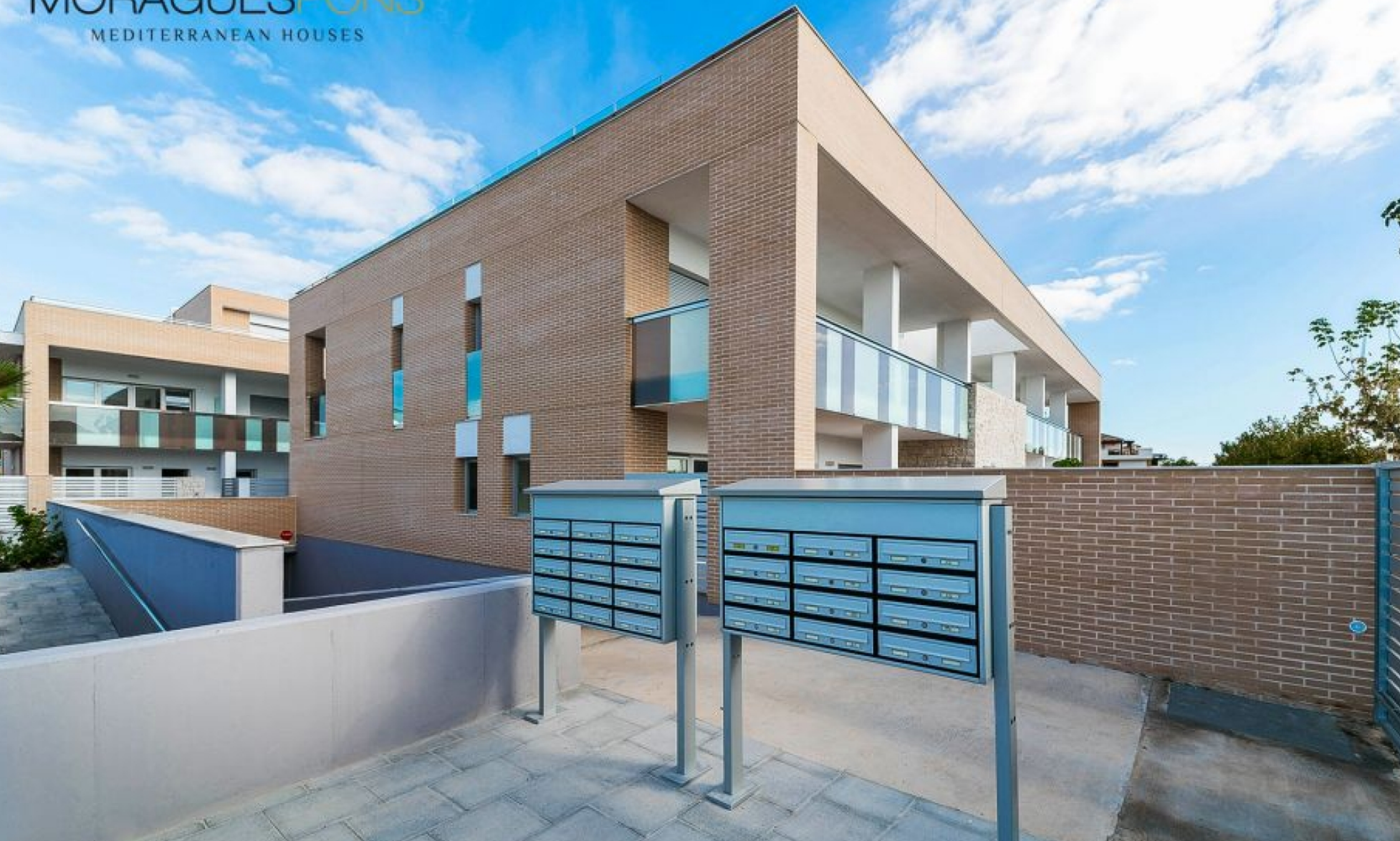
ebenerdiger Neubau in der Nähe des Hafens von Jávea ALTSTADTZENTRUM, JÁVEA/XÀBIA - REF. IV-B3