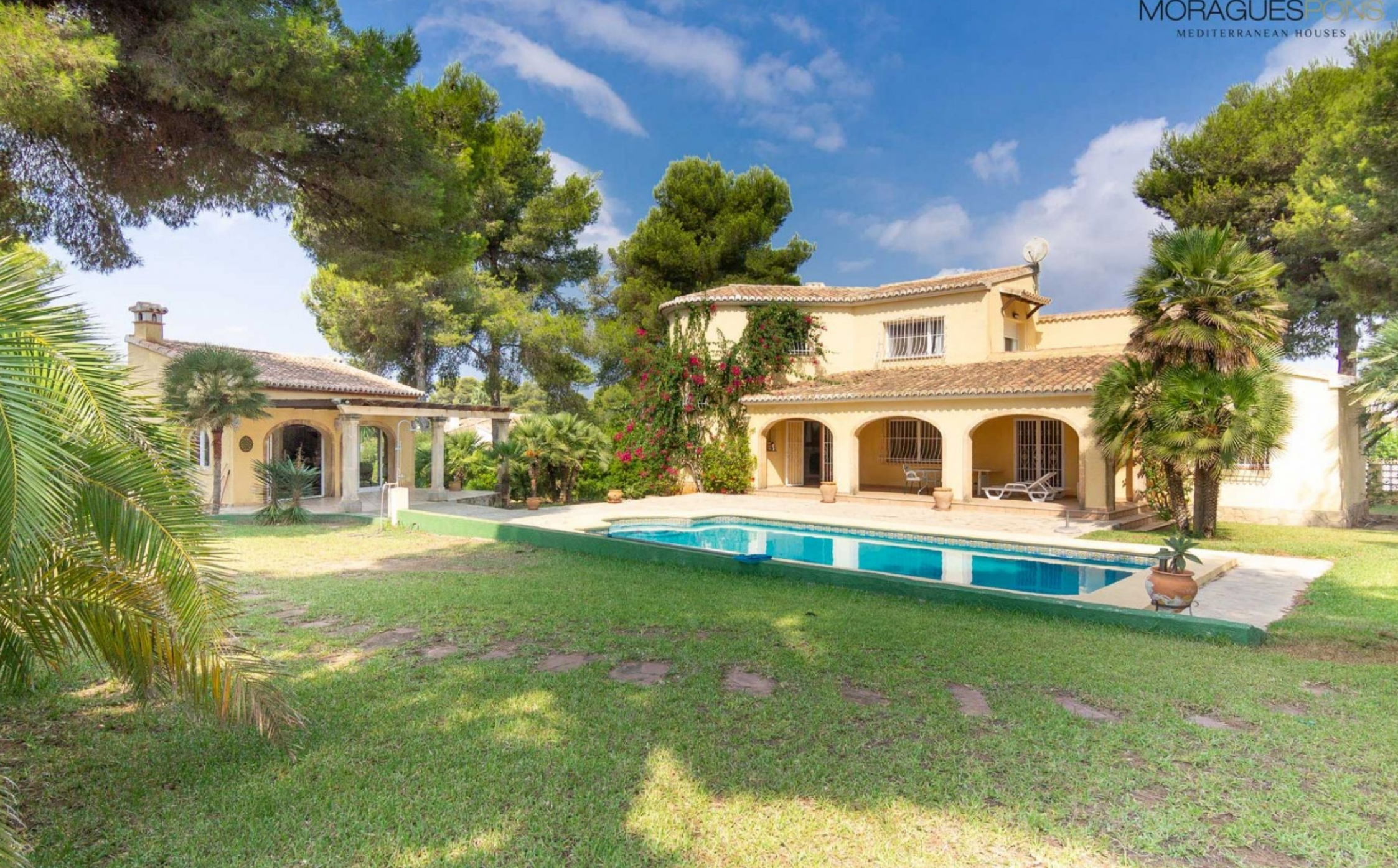
Fabelhaftes Haus in Costanova - Jávea

LA GRANADELLA - COSTA NOVA, JÁVEA/XÀBIA - REF. V-135