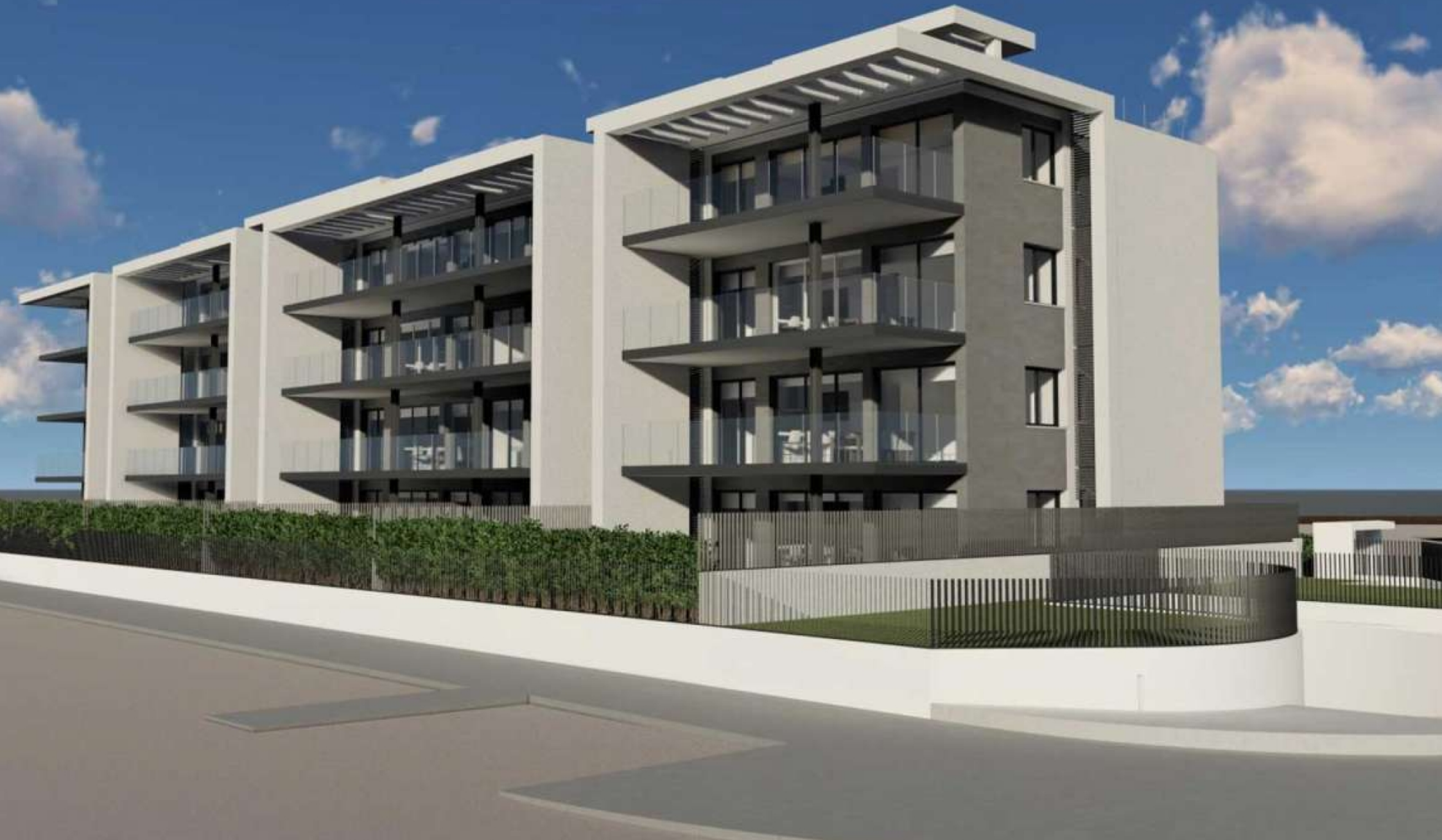
Neu gebaute Erdgeschosswohnung im Bau am Sandstrand von Jávea. MONTAÑAR - EL ARENAL, JÁVEA/XÀBIA - REF. A1-A