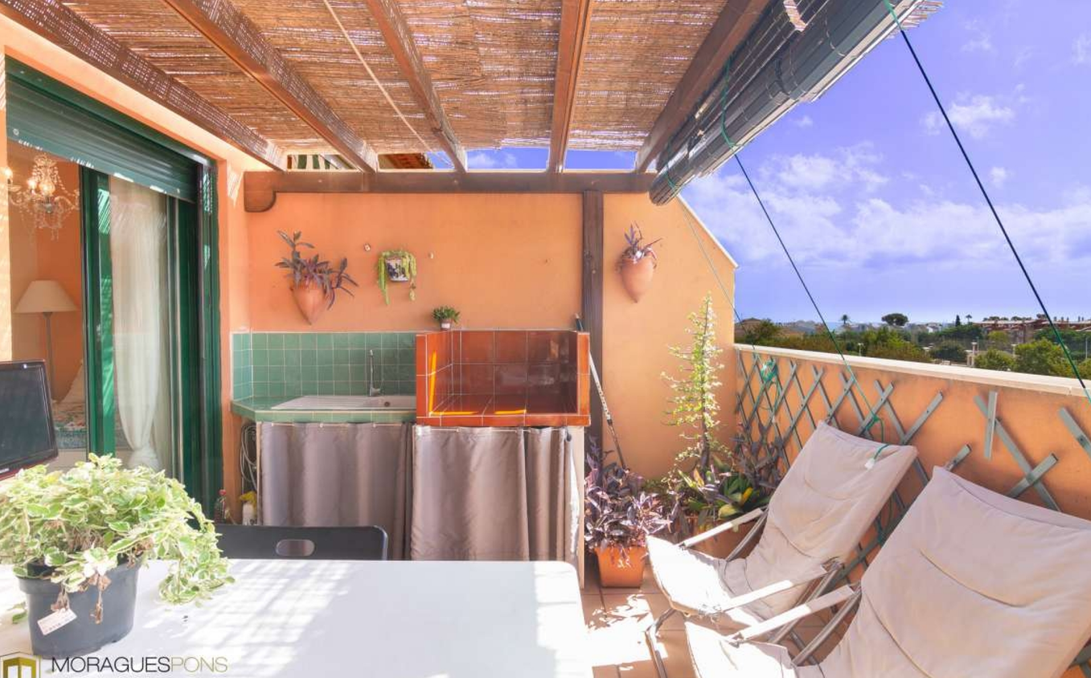
Penthouse mit Terrasse im Hafen von Jávea HAFEN, JÁVEA/XÀBIA - REF. A-358