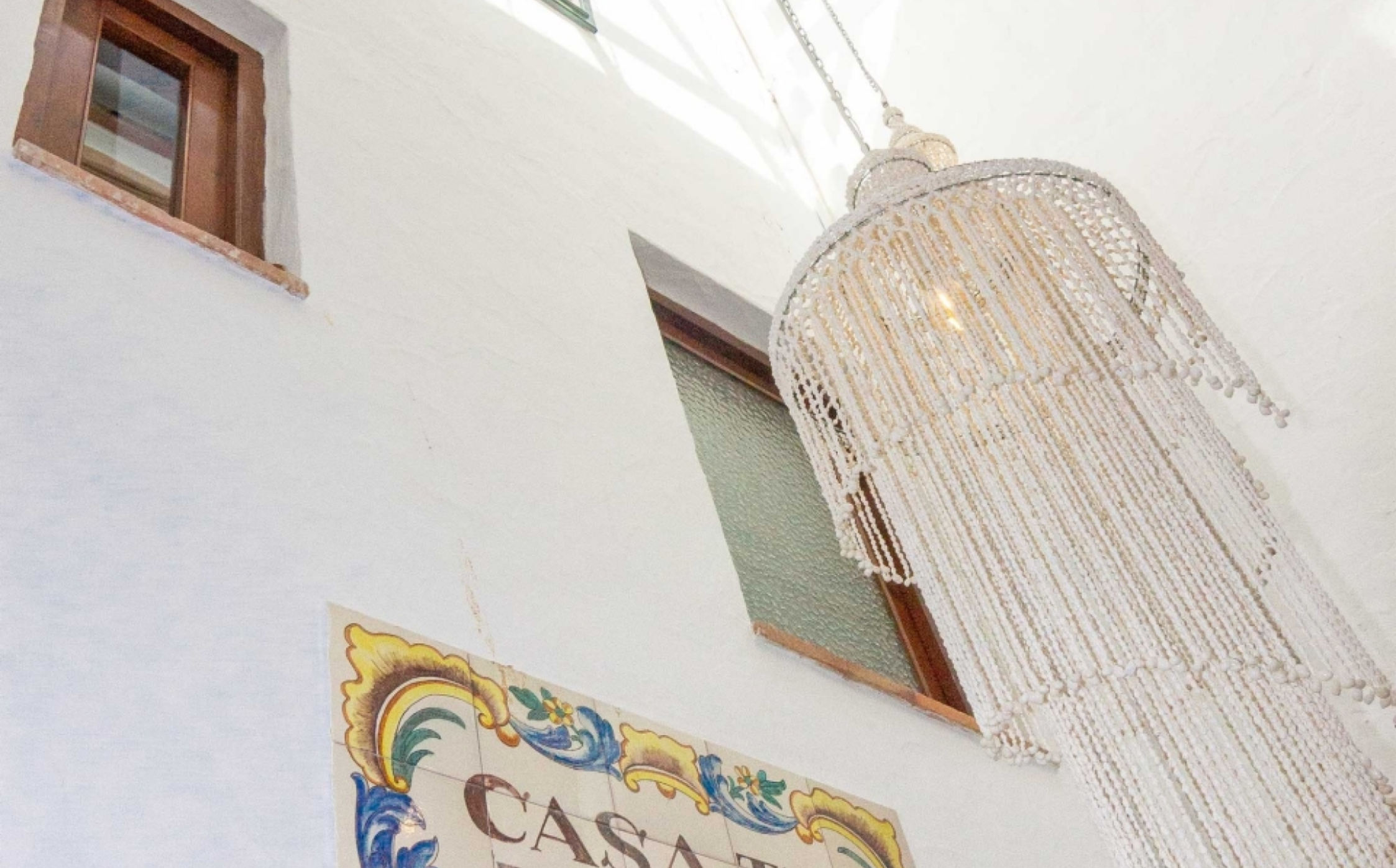
Stadthaus in Jávea in Exclusive mit MORAGUESPONS ALTSTADTZENTRUM, JÁVEA/XÀBIA - REF. V-475