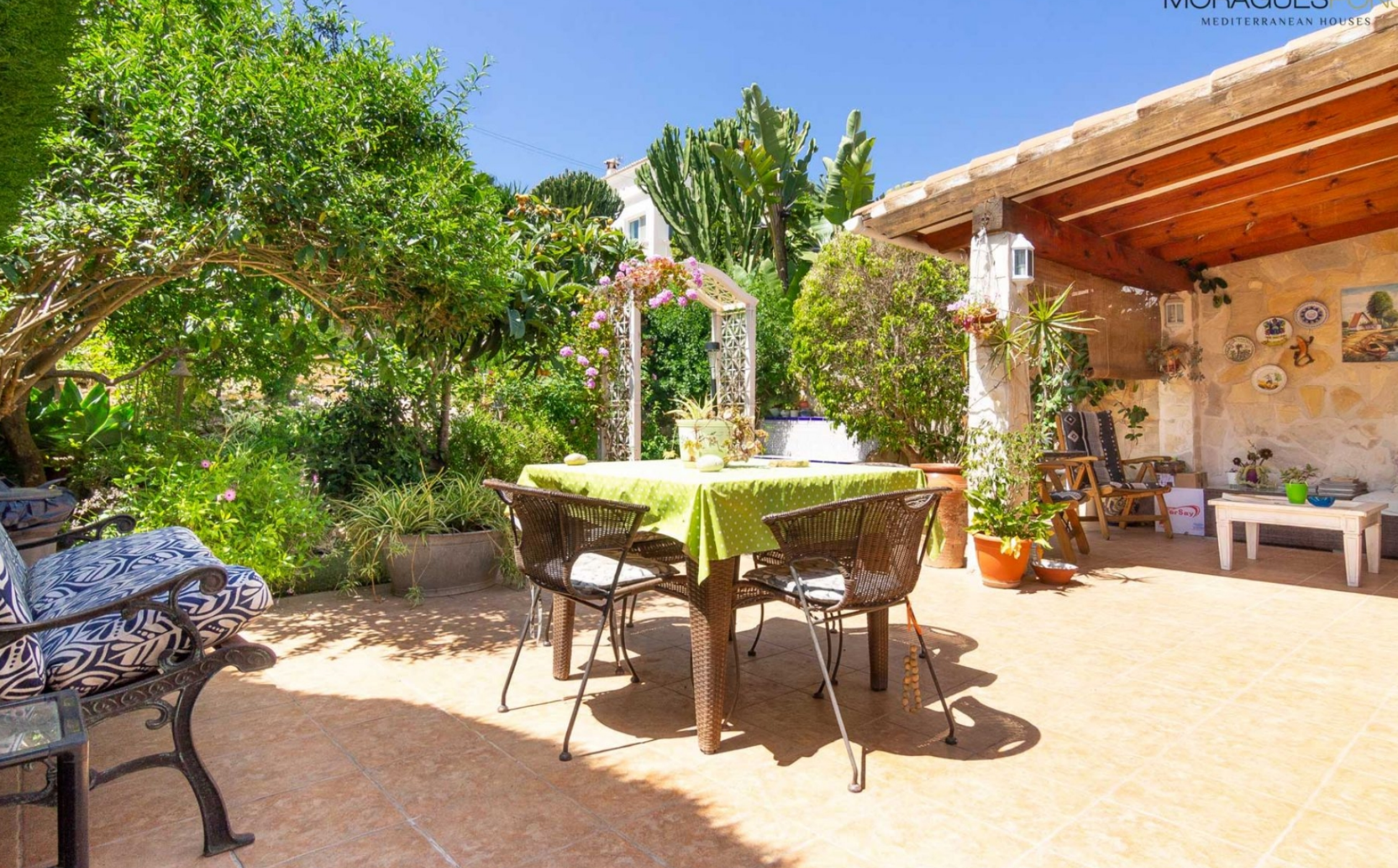
Stadthaus in Moraira, in der Nähe des Strandes von El Portet TEULADA - MORAIRA - REF. V-412