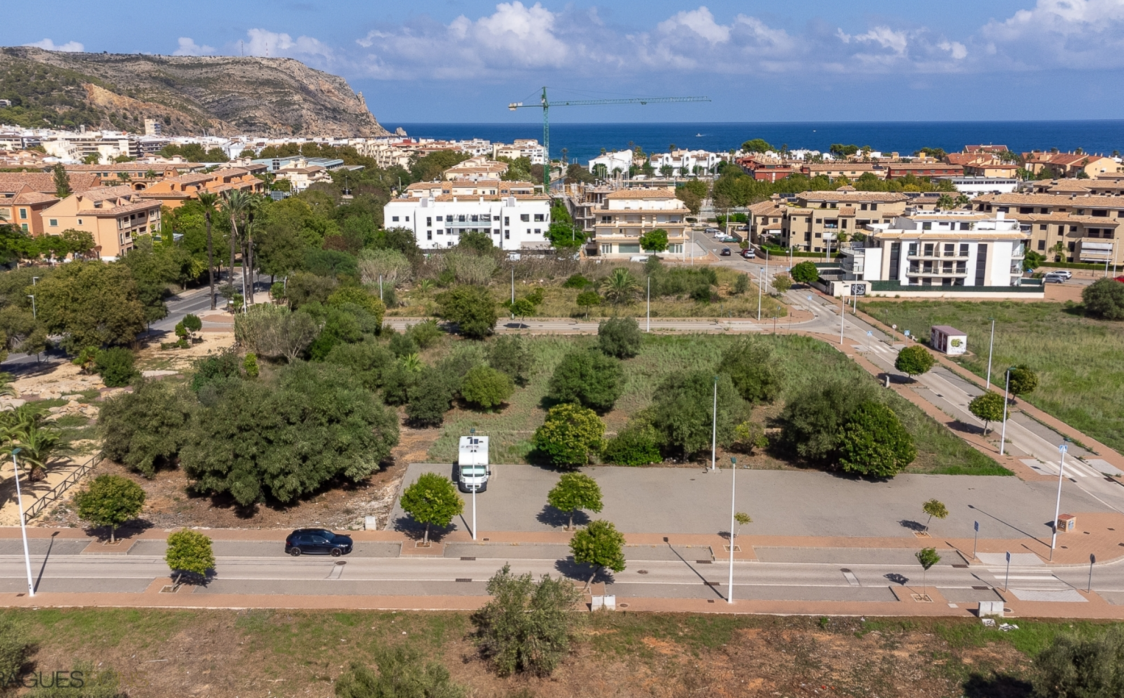
Städtisches Grundstück für tertiäre Nutzung neben dem Hafen von Jávea HAFEN, JÁVEA/XÀBIA - REF. S-070