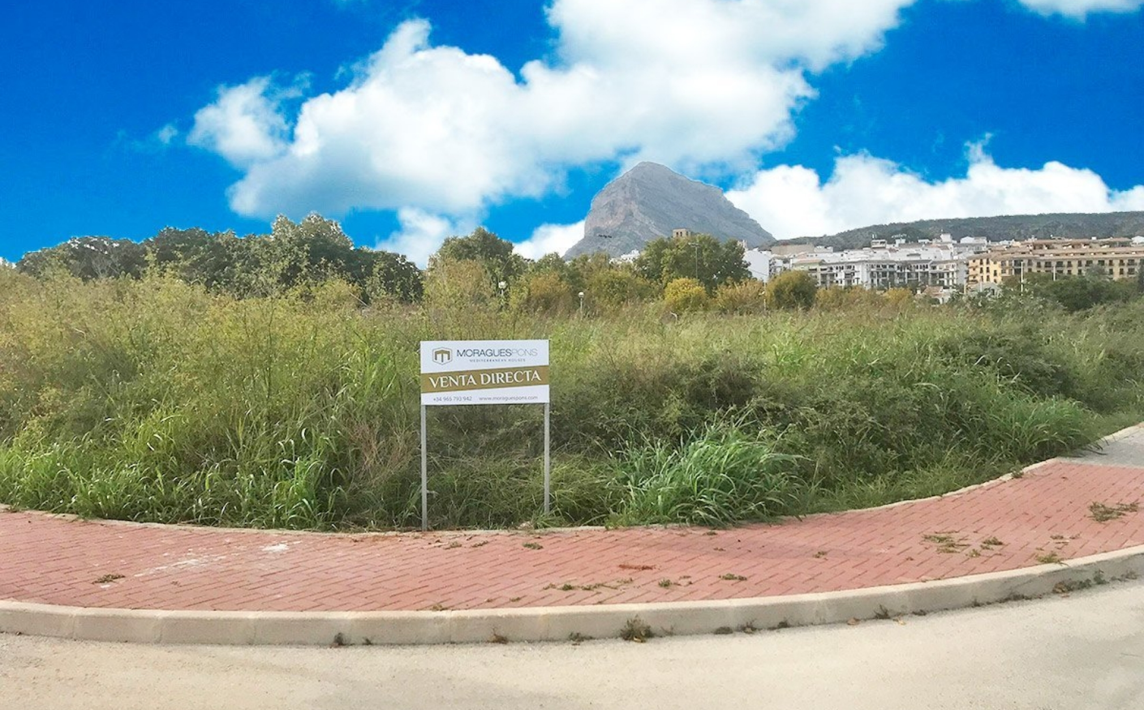
Urbanisiertes Baugrundstück in Javea ALTSTADTZENTRUM, JÁVEA/XÀBIA - REF. S-003