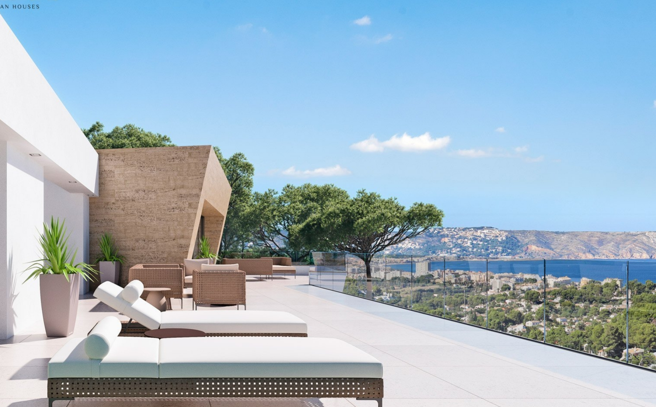
Villa im Bau mit Blick auf die Bucht von Jávea CAP MARTÍ - PINOMAR, JÁVEA/XÀBIA - REF. V-105