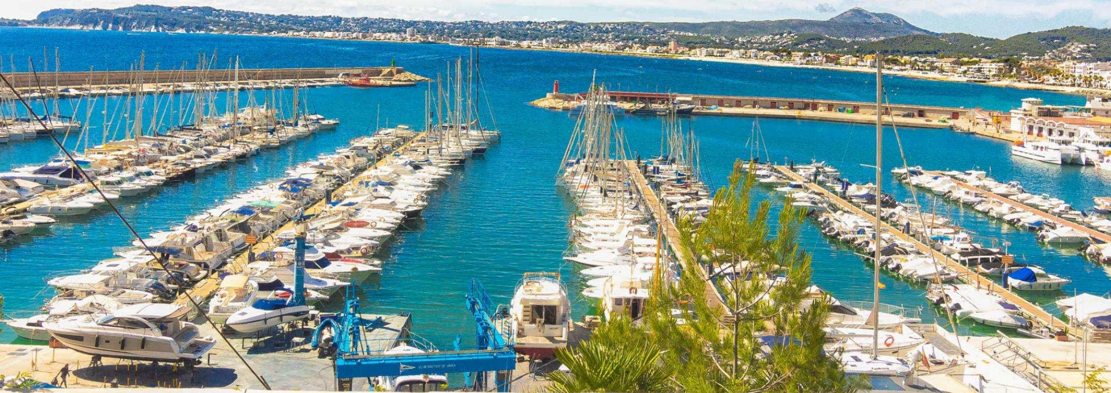
Villa im Hafen von Jávea