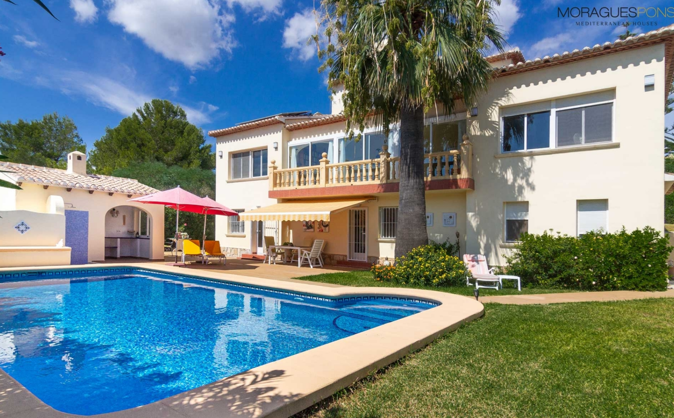
Villa neben dem Golfplatz von Jávea

PARTIDA COMUNES - ADSUBIA, JÁVEA/XÀBIA - REF. V-312