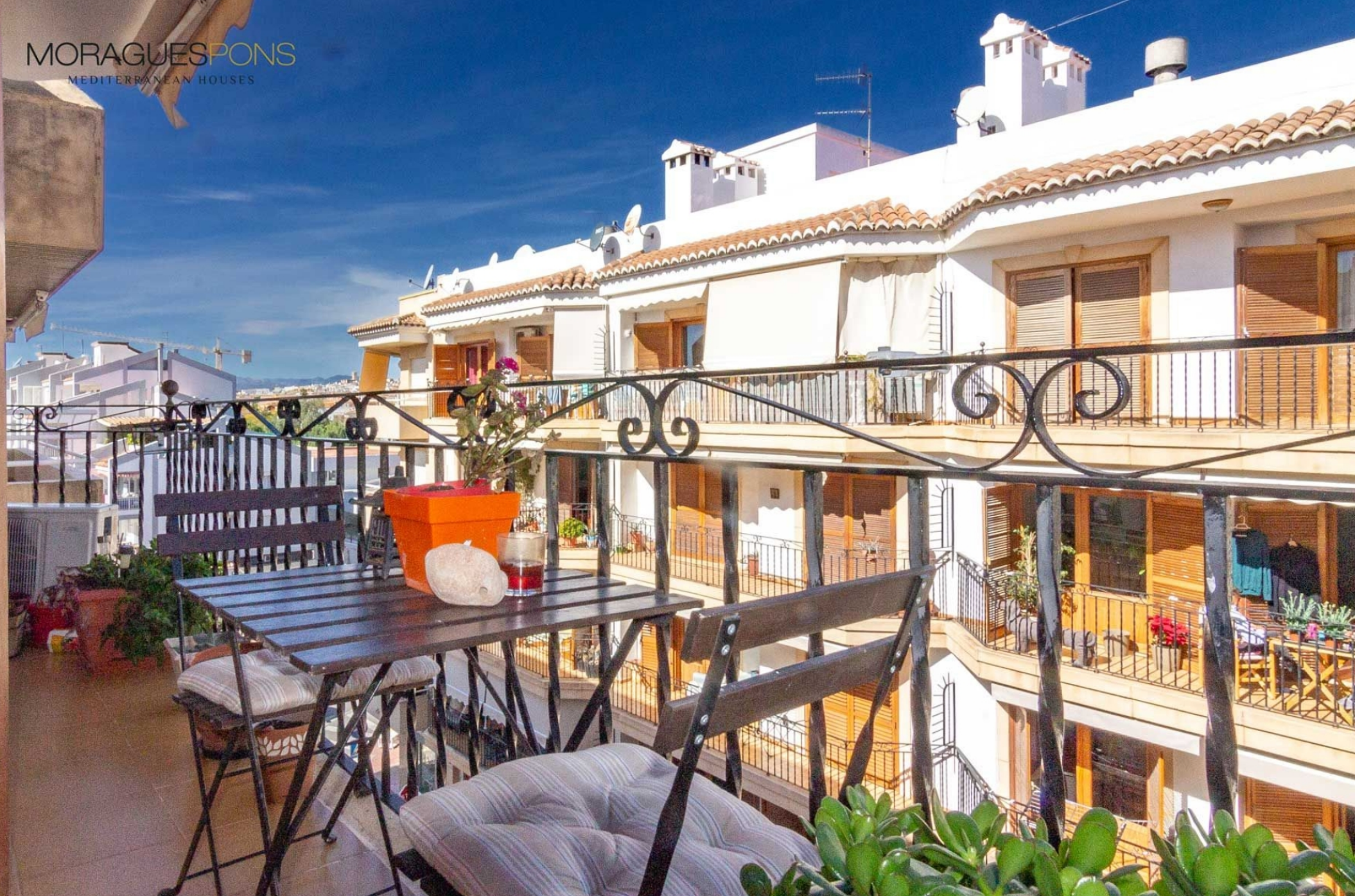
Wohnung im Herzen des Hafens von Jávea HAFEN, JÁVEA/XÀBIA - REF. A-351