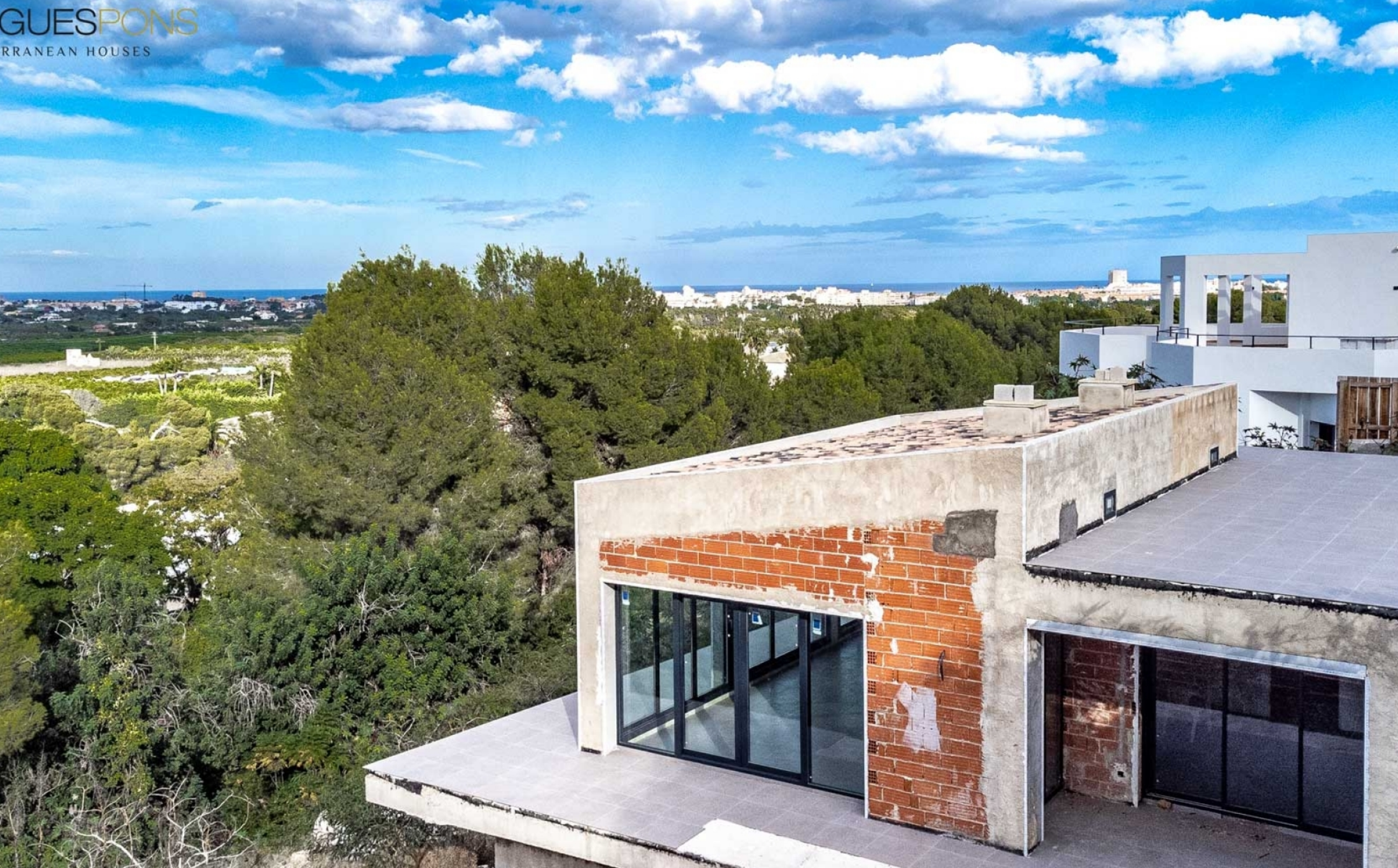
Villa in Puerta Fenicia, Jávea

PARTIDA COMUNES - ADSUBIA, JÁVEA/XÀBIA - REF. V-334