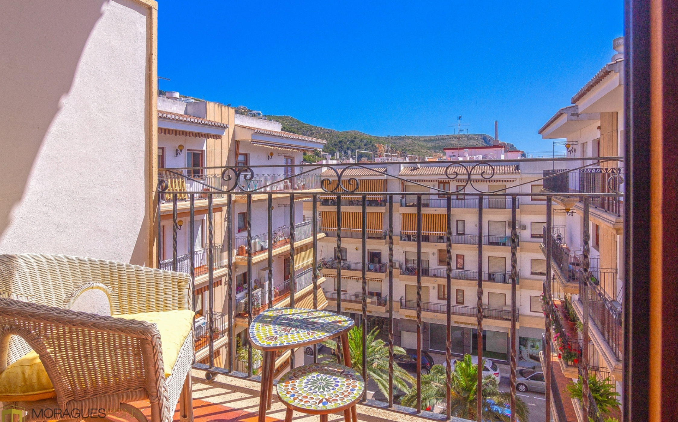
Appartement à vendre dans le port de Jávea PORT, JÁVEA/XÀBIA - REF. A-368