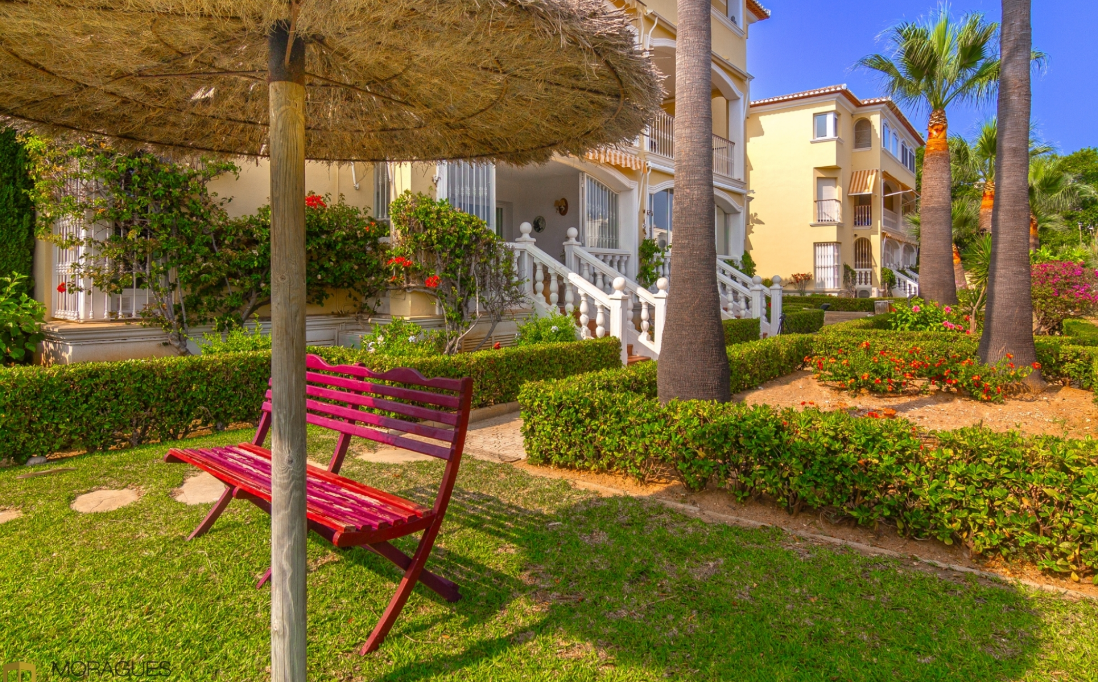
Appartement au rez-de-chaussée dans le port de Jávea PORT, JÁVEA/XÀBIA - REF. A-374