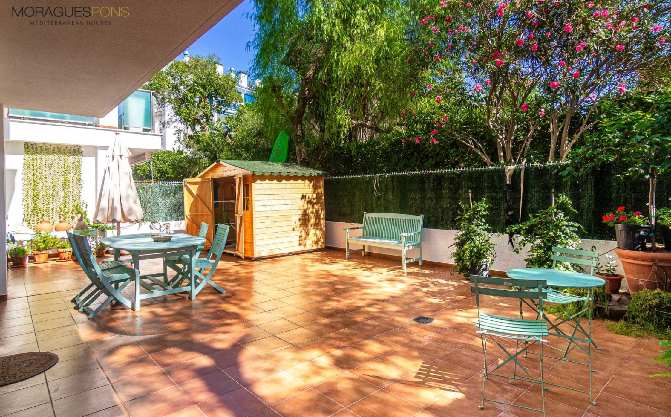
Appartement sur la plage de Jávea avec grande terrasse à vendre MONTAÑAR - EL ARENAL, JÁVEA/XÀBIA - REF. A-371