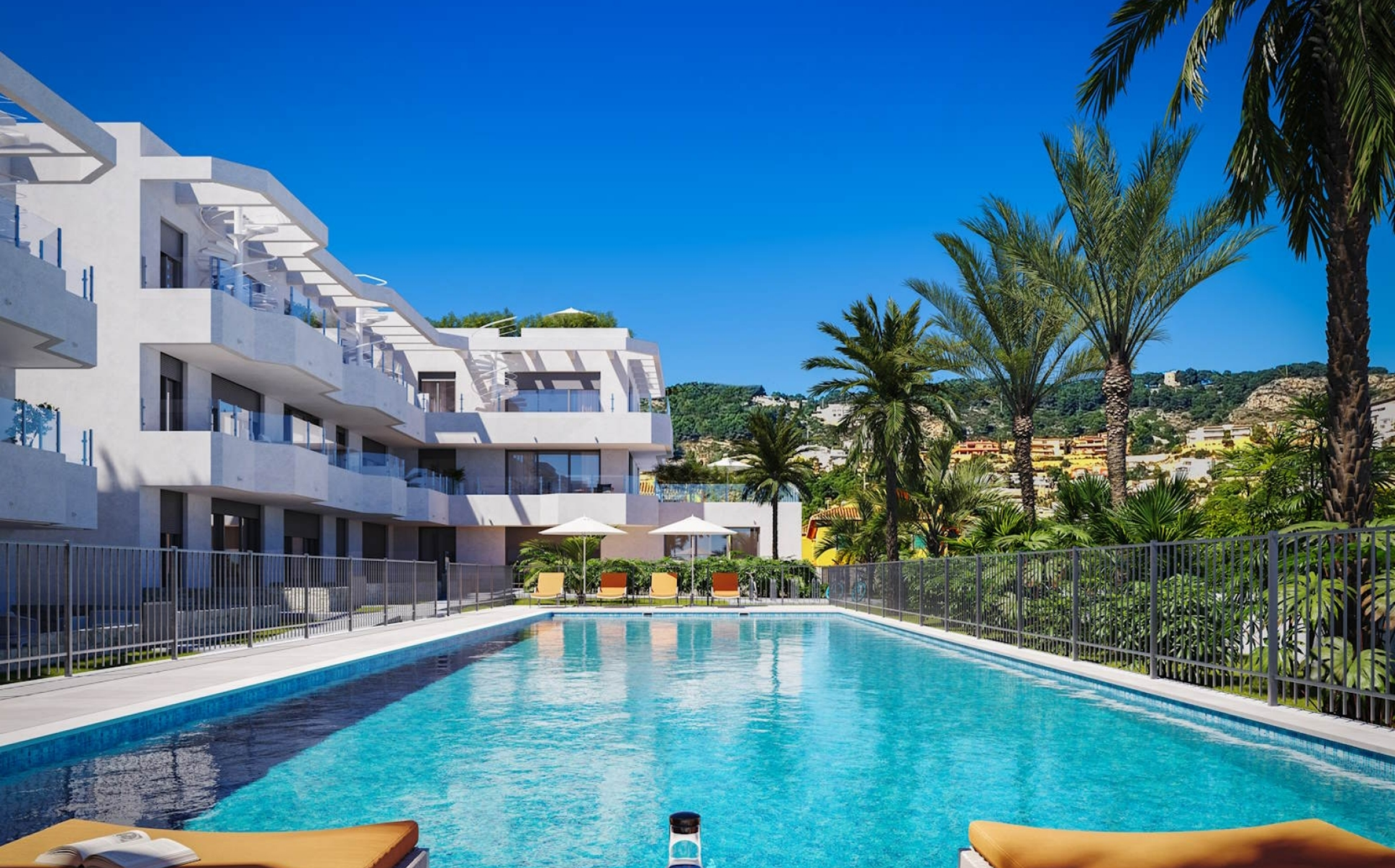
Attique neuf au port de Jávea PORT, JÁVEA/XÀBIA - REF. A-403