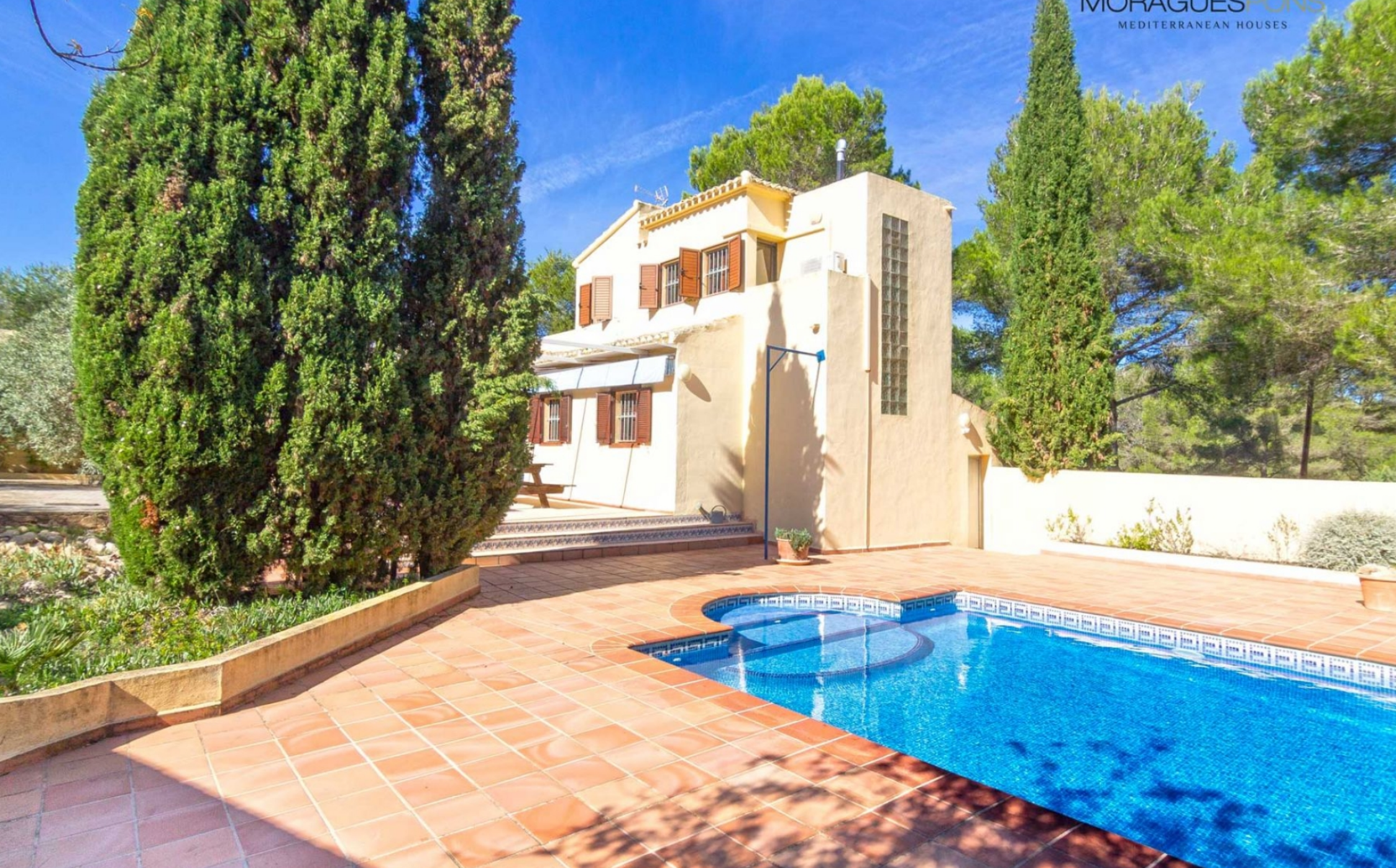
Fabuleuse maison de campagne à Las Planas, Jávea. CUESTA SAN ANTONIO - PUCHOL, JÁVEA/XÀBIA - REF. V-448