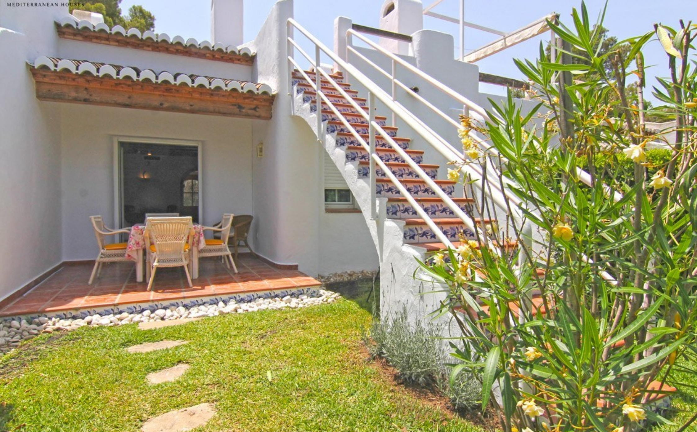
La jolie fille à mes yeux, toujours bien habillée. CAP MARTÍ - PINOMAR, JÁVEA/XÀBIA - REF. A-393