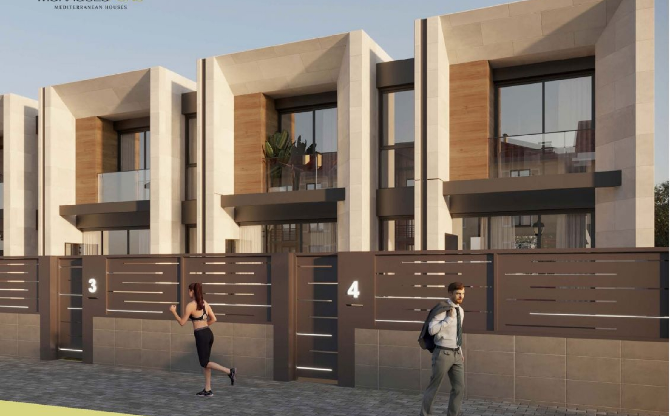
Maison avec piscine privée à Gata de Gorgos GATA DE GORGOS - REF. NATURE 5