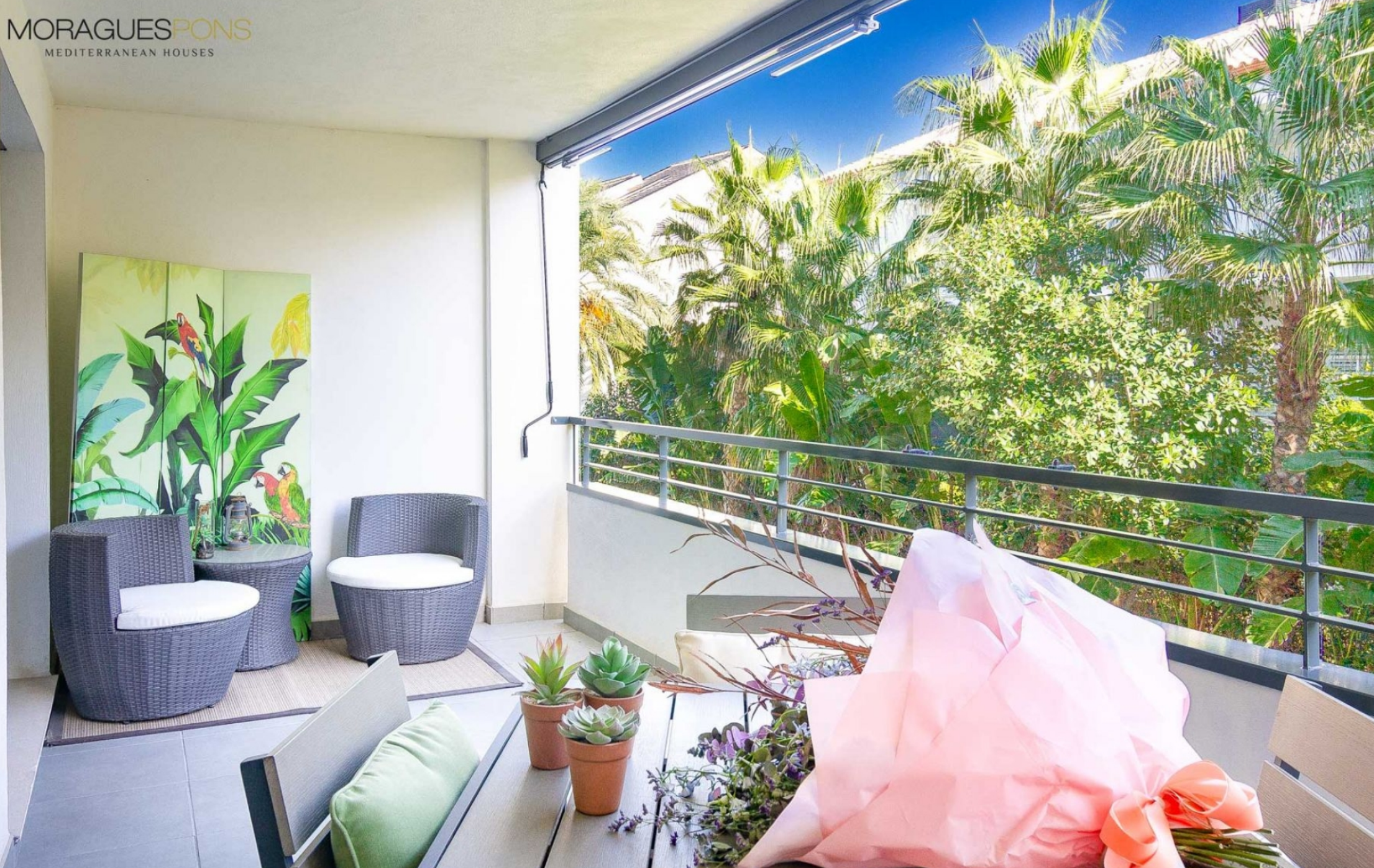
Nouvel appartement à Javea près de la plage MONTAÑAR - EL ARENAL, JÁVEA/XÀBIA - REF. A-347