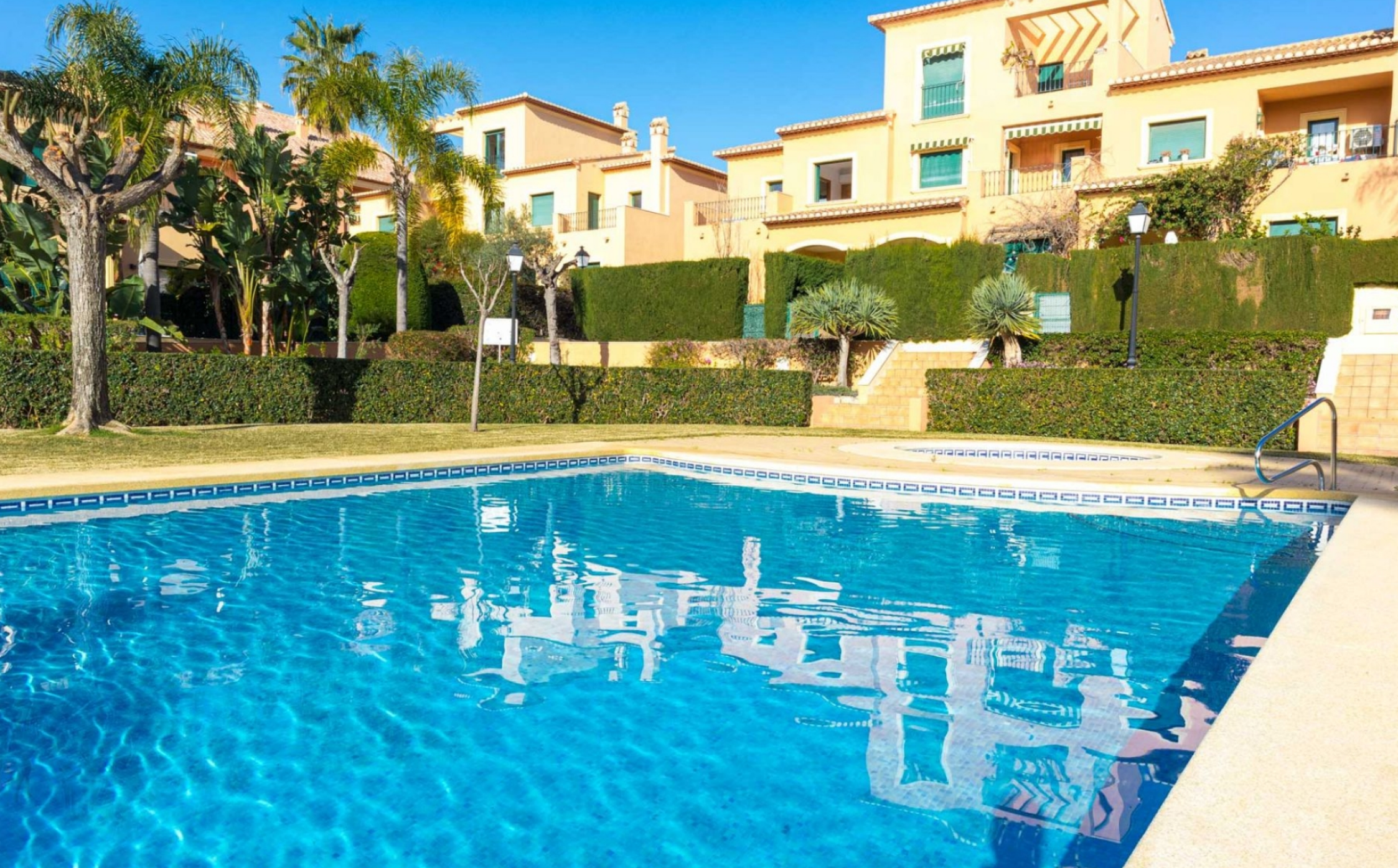
Penthouse avec piscine dans le port de Jávea PORT, JÁVEA/XÀBIA - REF. A-360