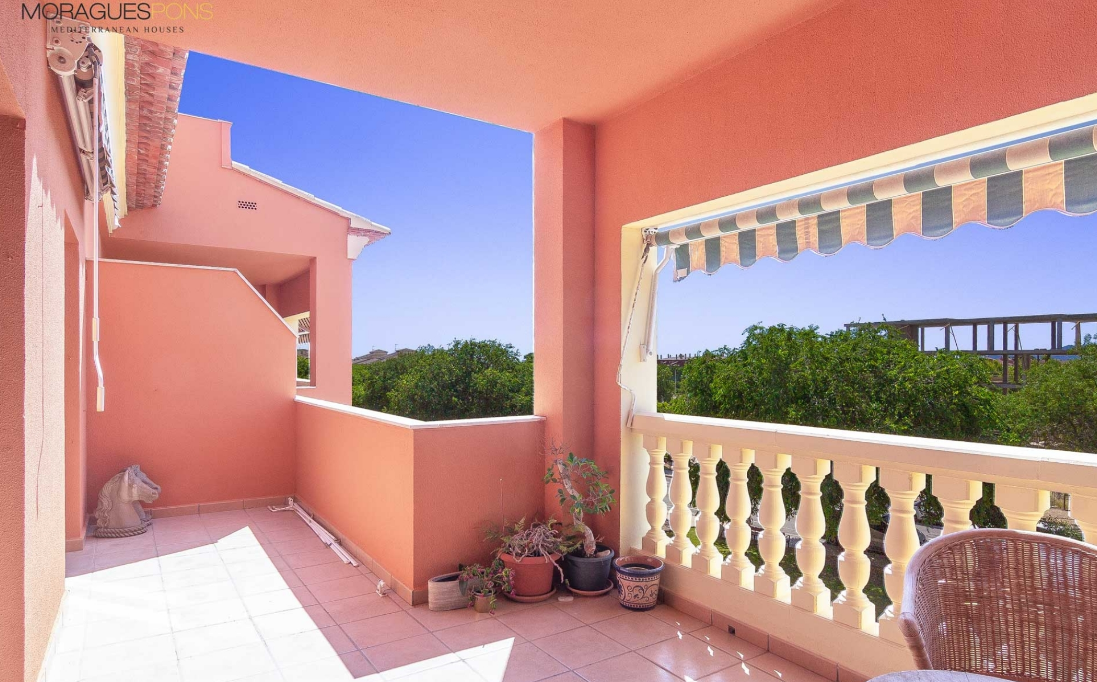
Penthouse dans le port de Jávea PORT, JÁVEA/XÀBIA - REF. A-366