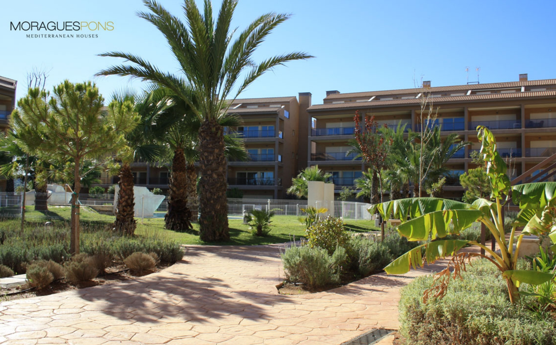
Penthouse en duplex sur la plage d'el Arenal MONTAÑAR - EL ARENAL, JÁVEA/XÀBIA - REF. A-348