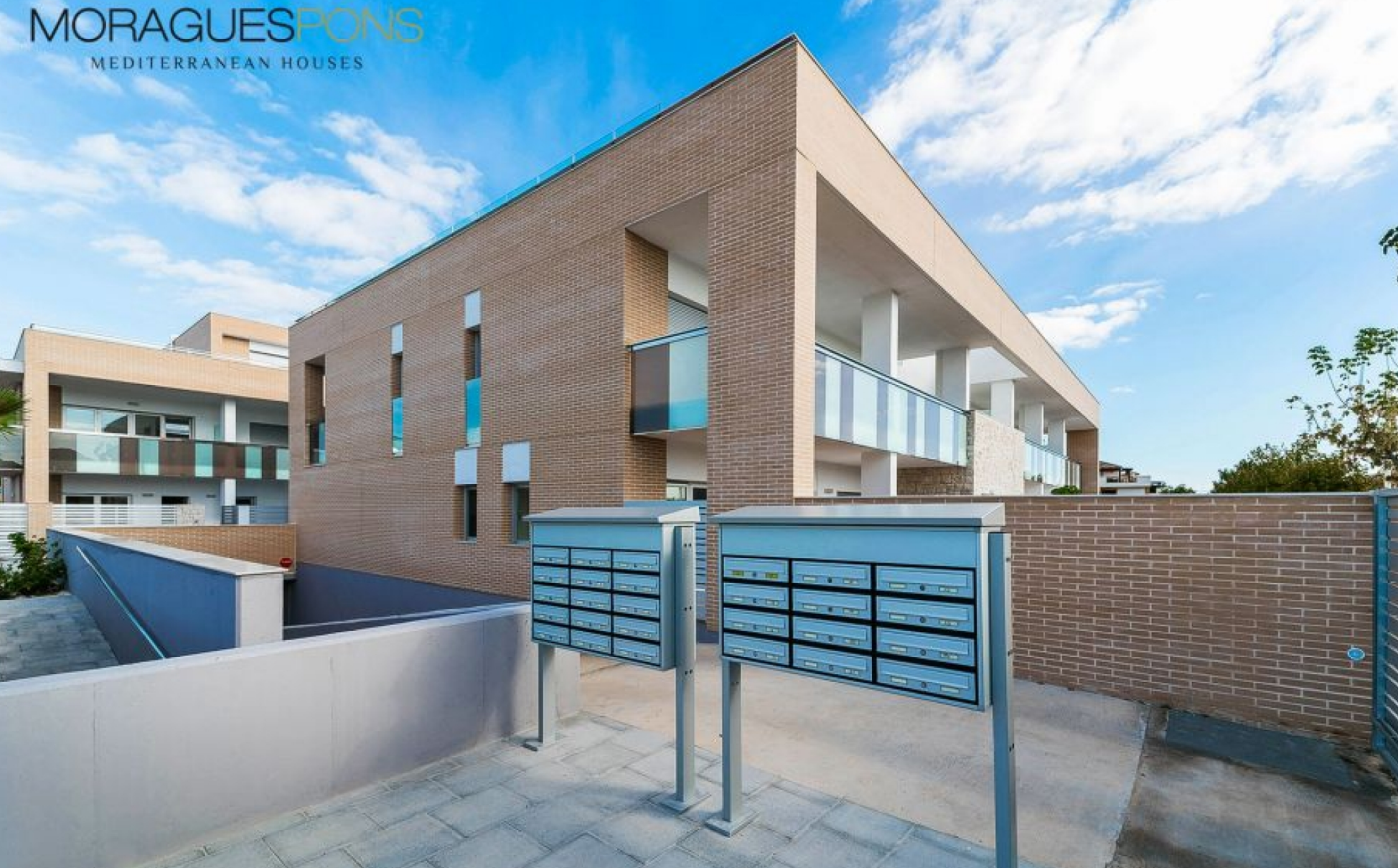
Rez de chaussée d'une nouvelle construction près du port de Jávea VIEILLE VILLE, JÁVEA/XÀBIA - REF. IV-B3