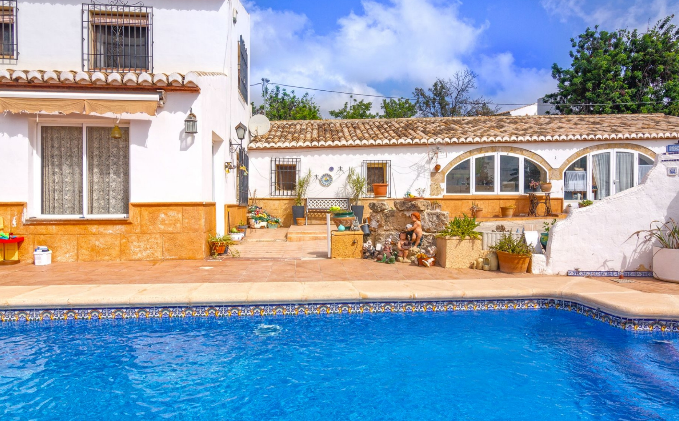
Villa à proximité de la ville de Jávea VIEILLE VILLE, JÁVEA/XÀBIA - REF. V-319