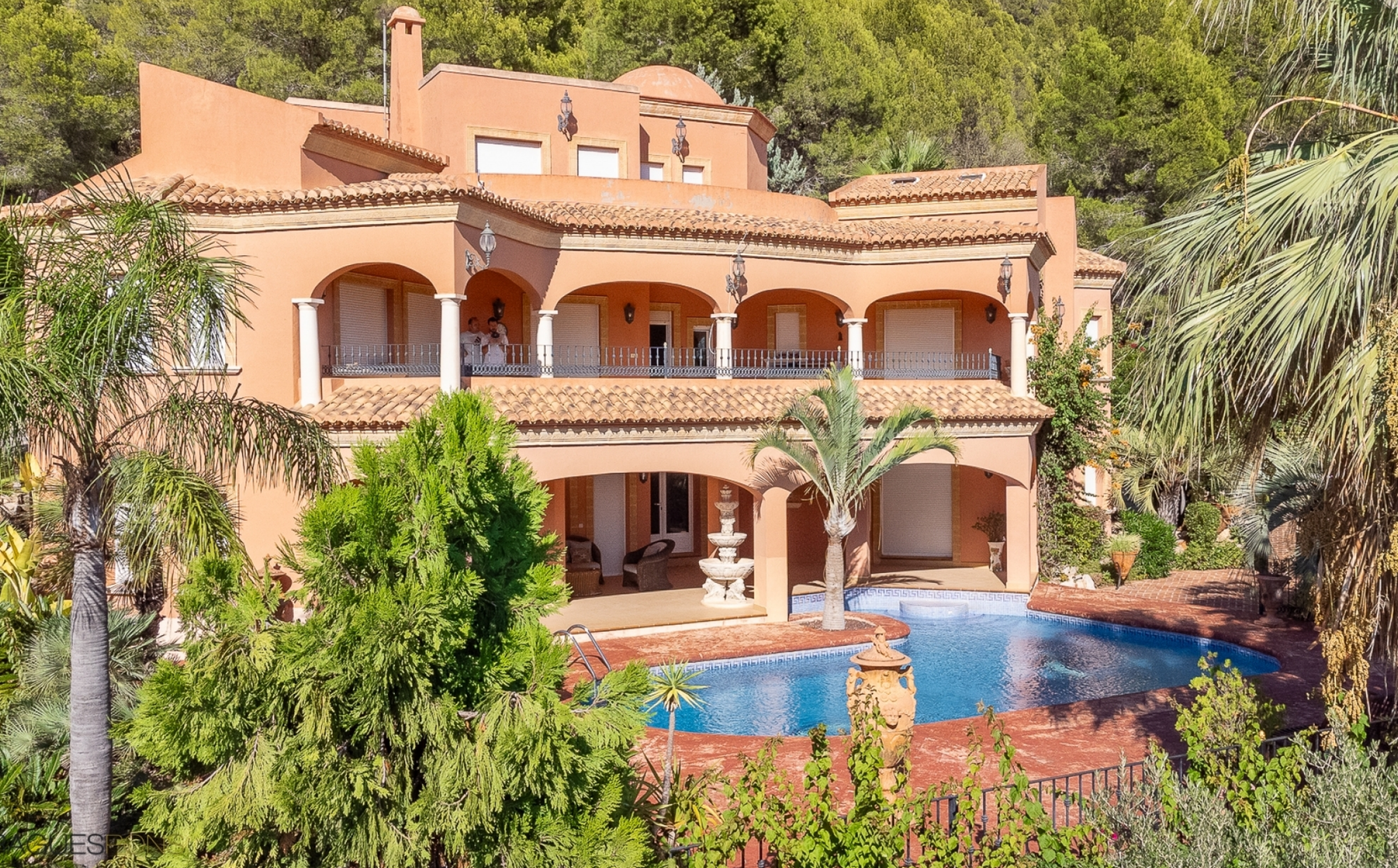
Villa avec grand terrain et vue dégagée à Jávea. MONTGÓ - PARTIDA TOSAL, JÁVEA/XÀBIA - REF. V-408