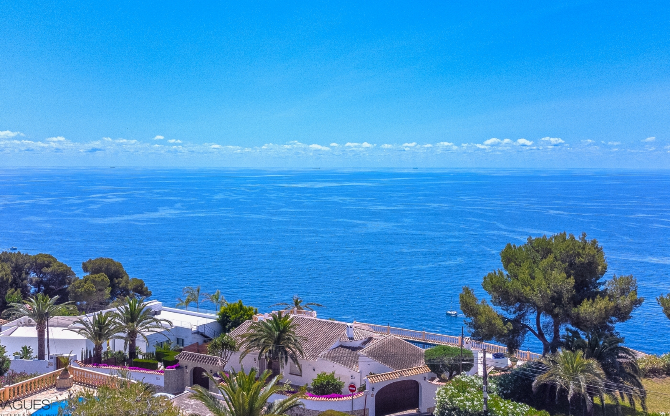
Villa avec vue imprenable sur la mer à Jávea BALCÓN AL MAR - PORTICHOL, JÁVEA/XÀBIA - REF. V-477