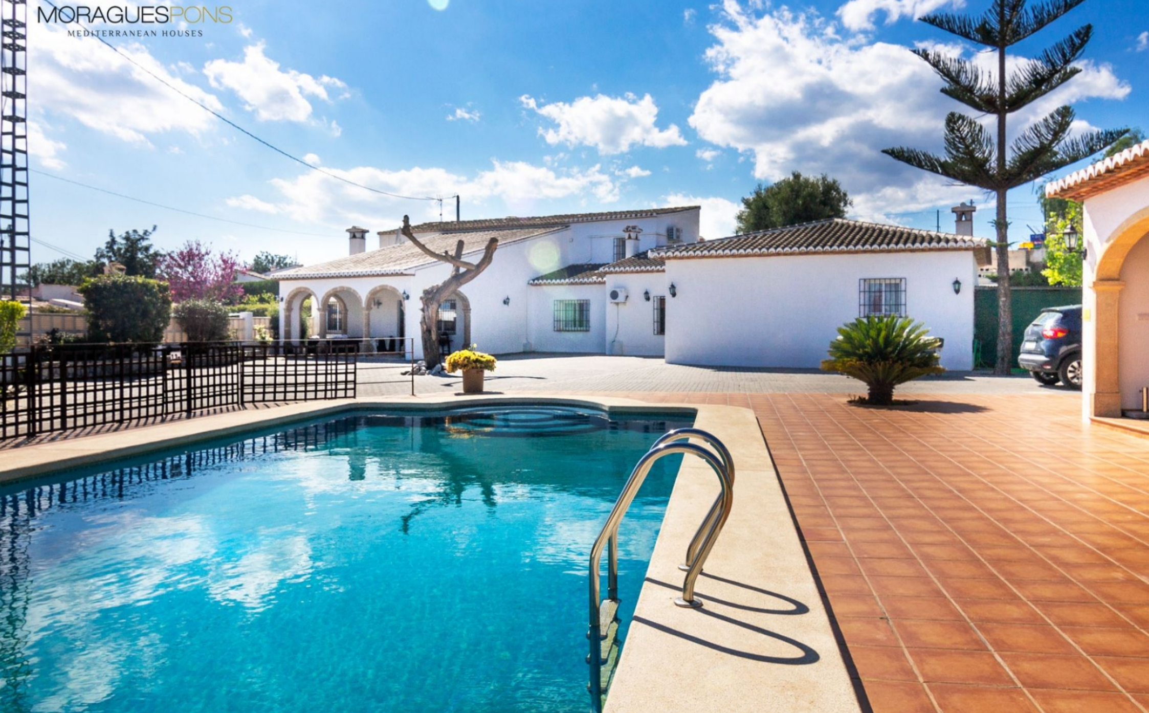
Villa dans le village de Jávea VIEILLE VILLE, JÁVEA/XÀBIA - REF. V-393