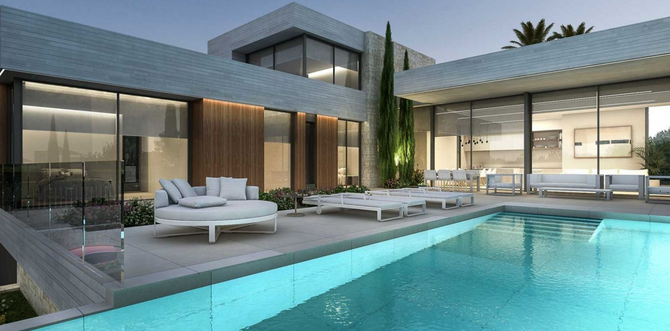
Villa de luxe à Moraira avec vue sur la mer