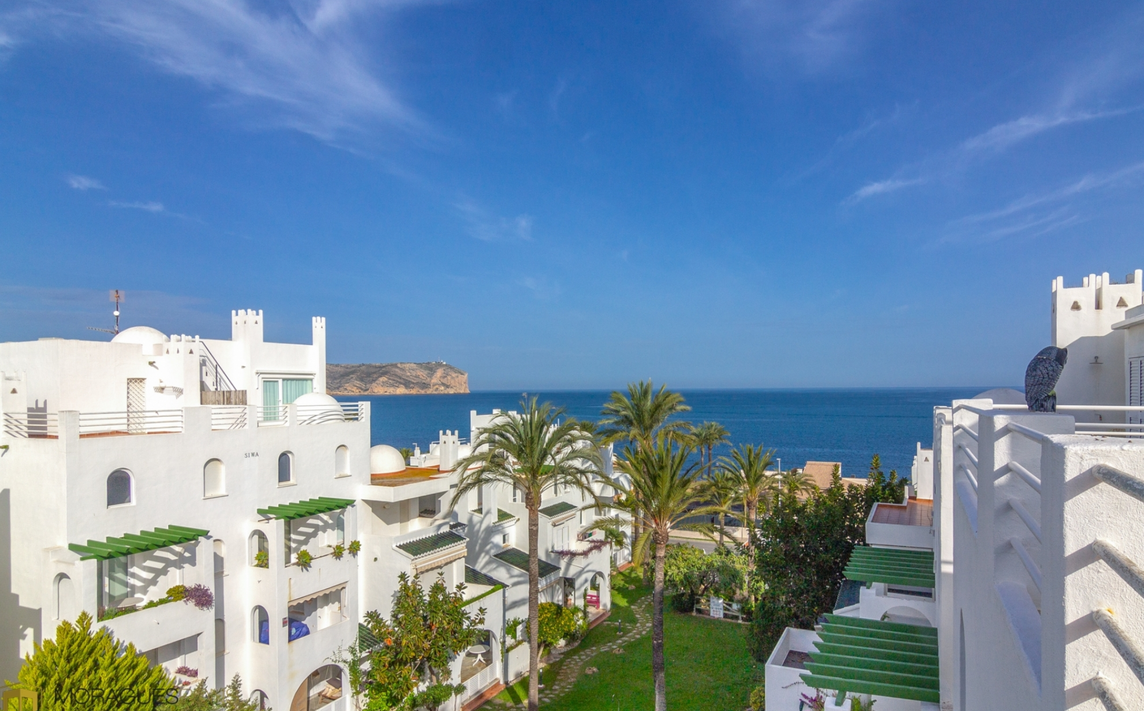
Duplex penthouse in het tweede Montañar van Jávea MONTAÑAR - EL ARENAL, JÁVEA/XÀBIA - REF. A-453