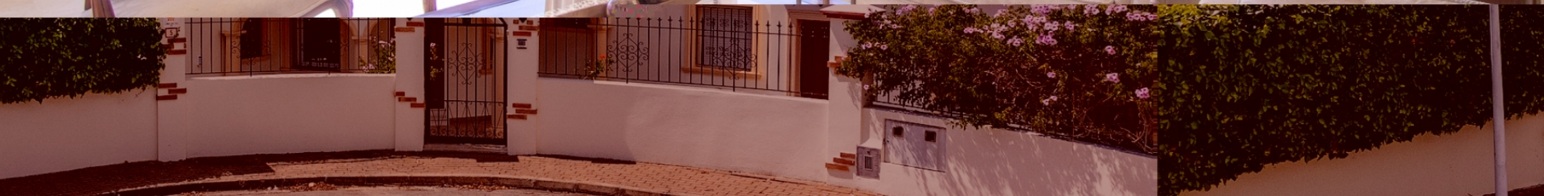
Luxe villa in de urbanisatie Las Laderas van Jávea PARTIDA COMUNES - ADSUBIA, JÁVEA/XÀBIA - REF. V-490