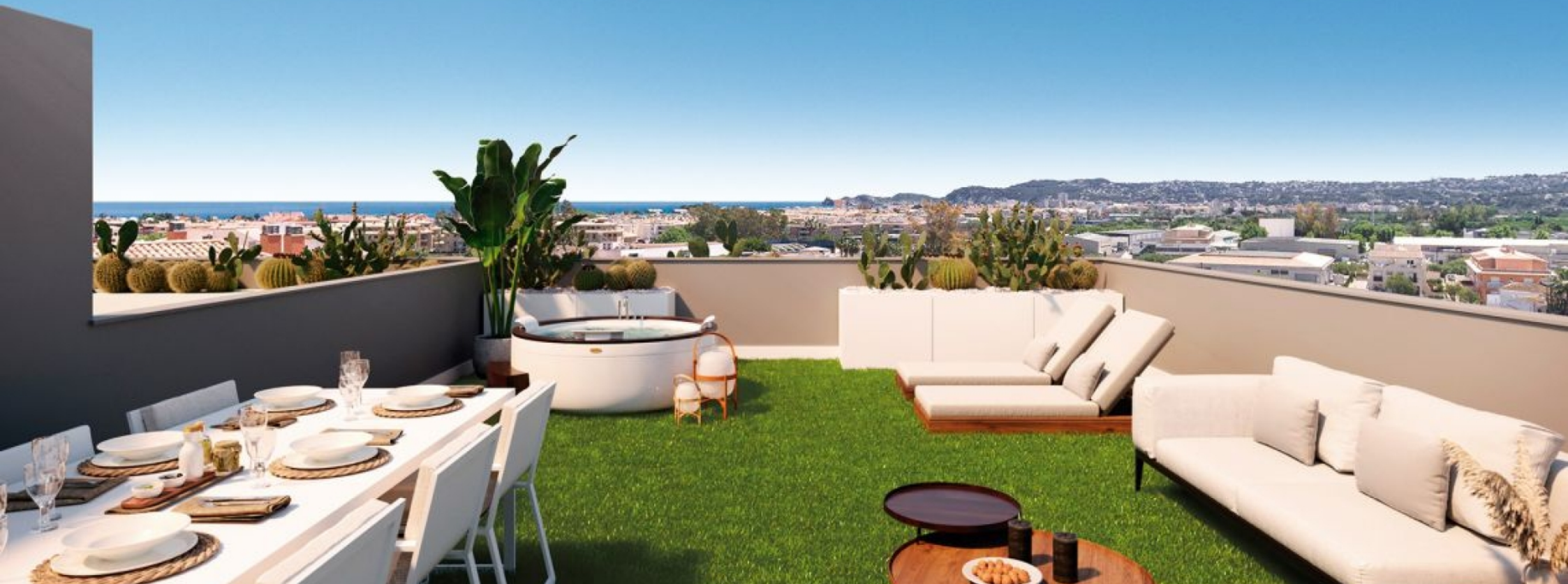
Nuevo residencial Essencial Jávea, apartamento en planta primera de obra nueva. CENTRO CIUDAD, JÁVEA/XÀBIA - REF. EB1-29