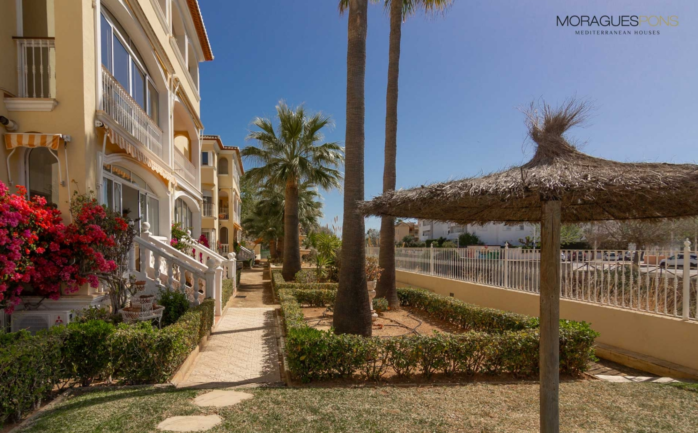
Planta baja recién reformada en el Puerto de Jávea a 450m de la playa de la Grava. PUERTO, JÁVEA/XÀBIA - REF. A-405