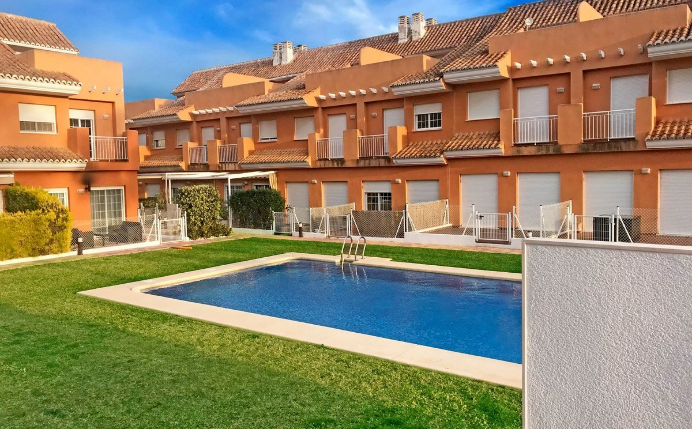
Adosado con piscina en Jávea CENTRO CIUDAD, JÁVEA/XÀBIA - REF. A-420