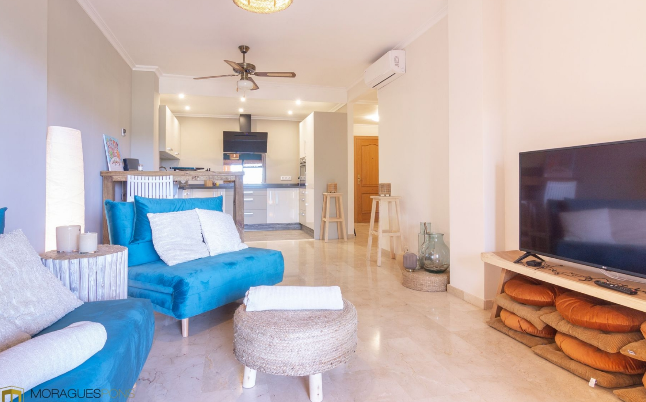
Apartamento a la venta en el puerto de Jávea PUERTO, JÁVEA/XÀBIA - REF. A-350