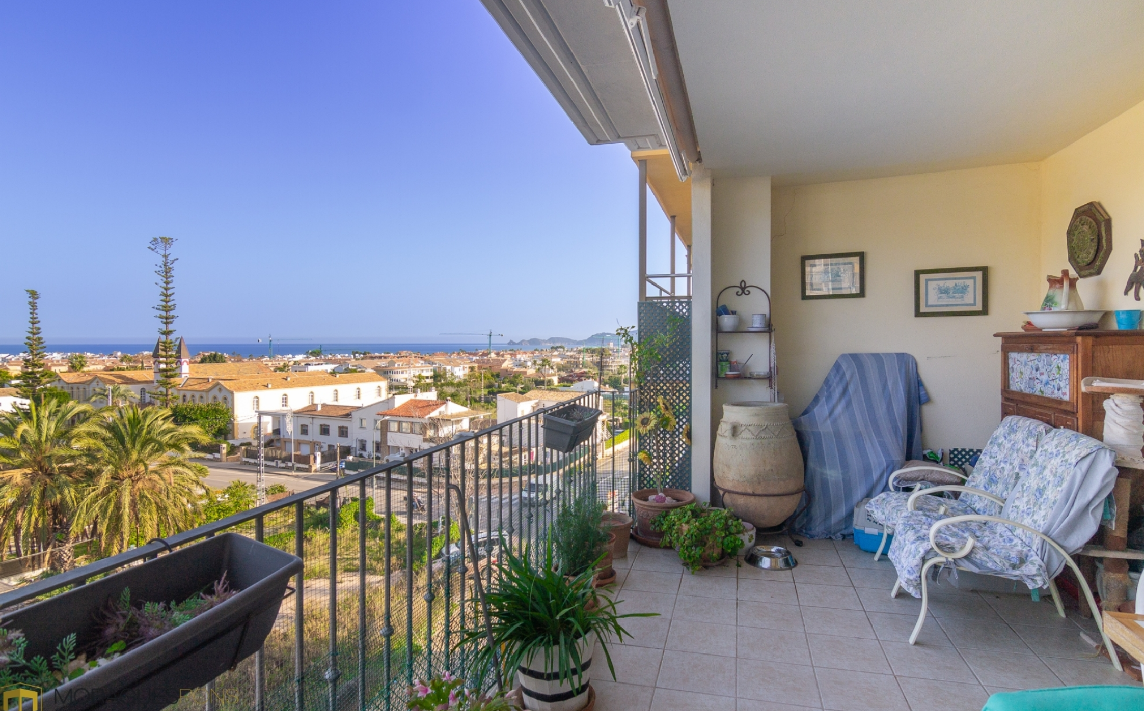
Apartamento con vistas al mar CENTRO CIUDAD, JÁVEA/XÀBIA - REF. A-363