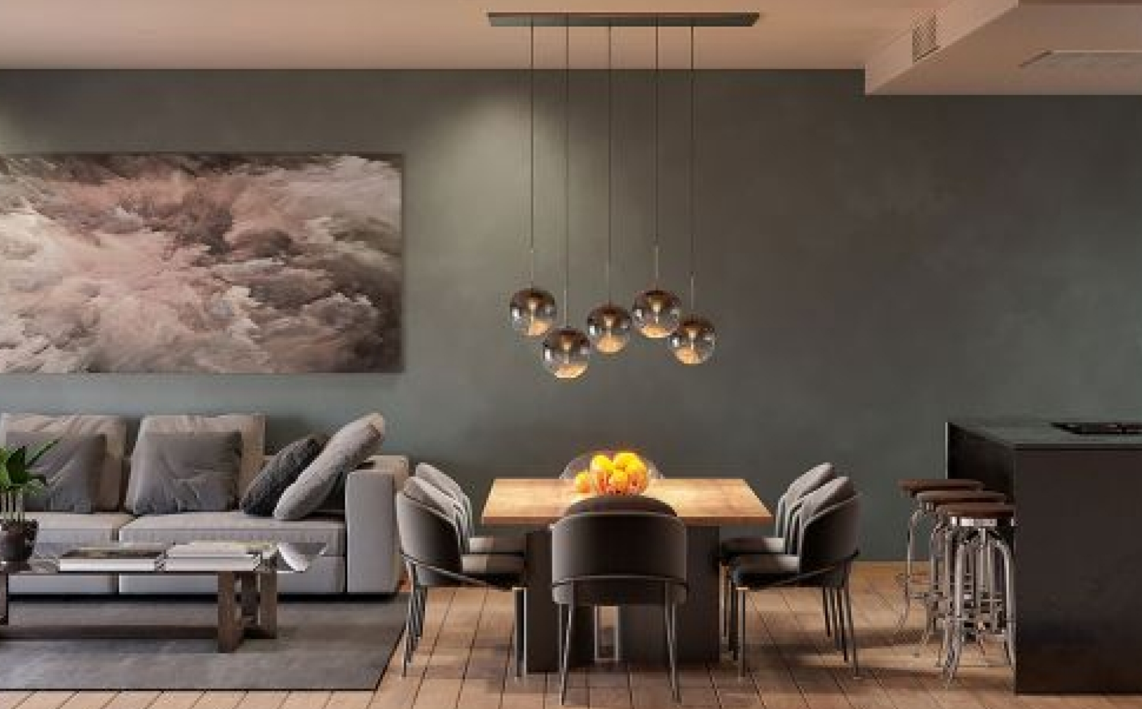
Apartamento de obra nueva con piscina en el puerto de Jávea PUERTO, JÁVEA/XÀBIA - REF. PRIMEIA