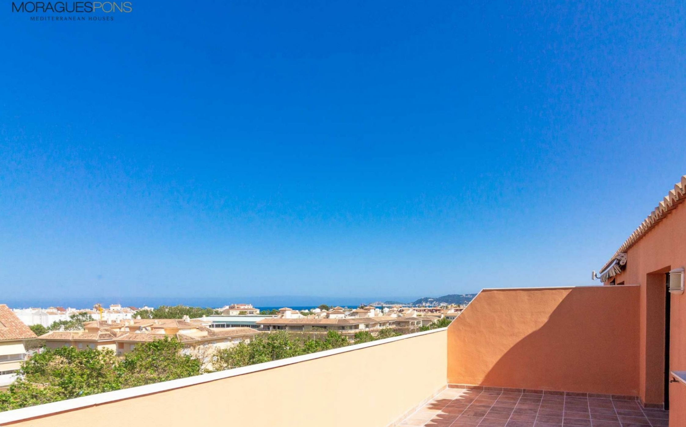
Ático en el puerto de Jávea PUERTO, JÁVEA/XÀBIA - REF. A-336