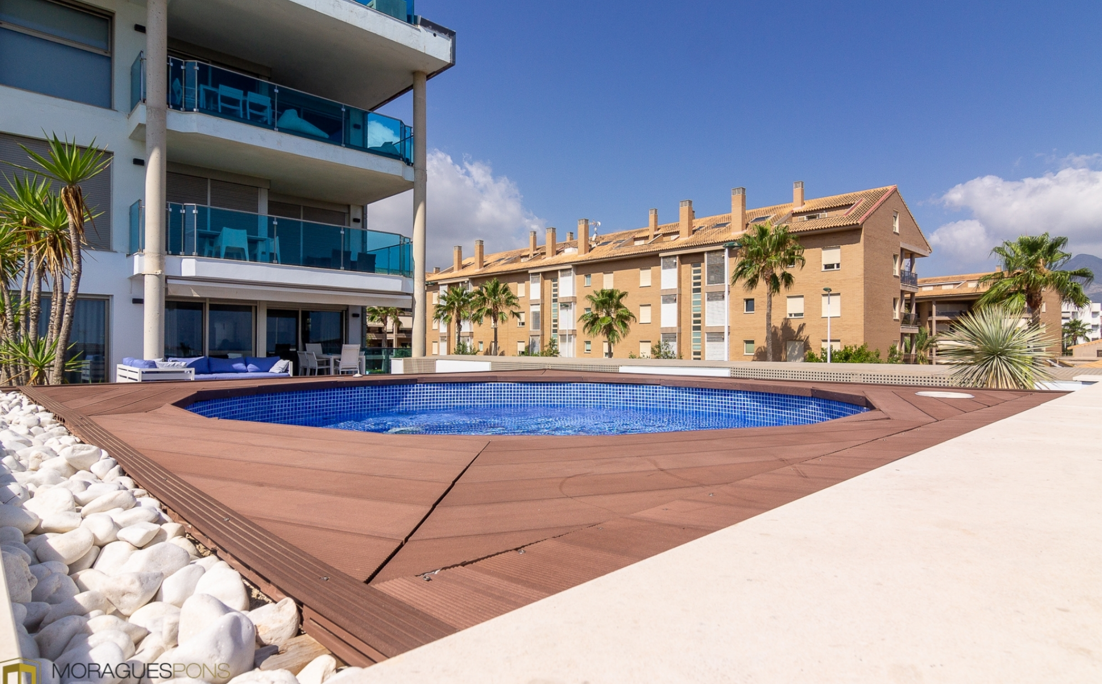
Bajo con vistas al mar y piscina privada en Jávea MONTAÑAR - EL ARENAL, JÁVEA/XÀBIA - REF. A-375