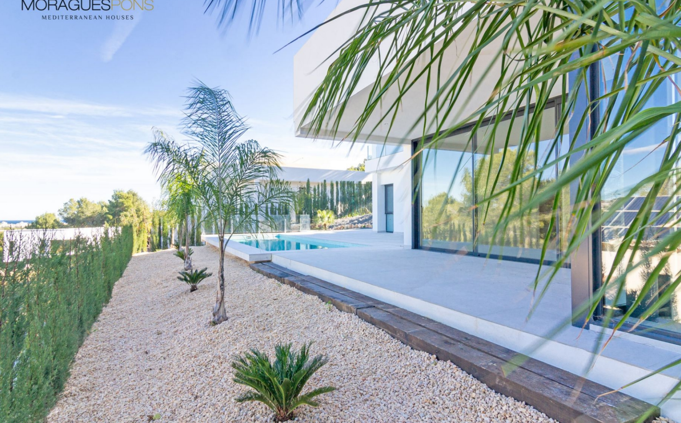
Casa de nueva construcción con vista al mar PARTIDA COMUNES - ADSUBIA, JÁVEA/XÀBIA - REF. V-362