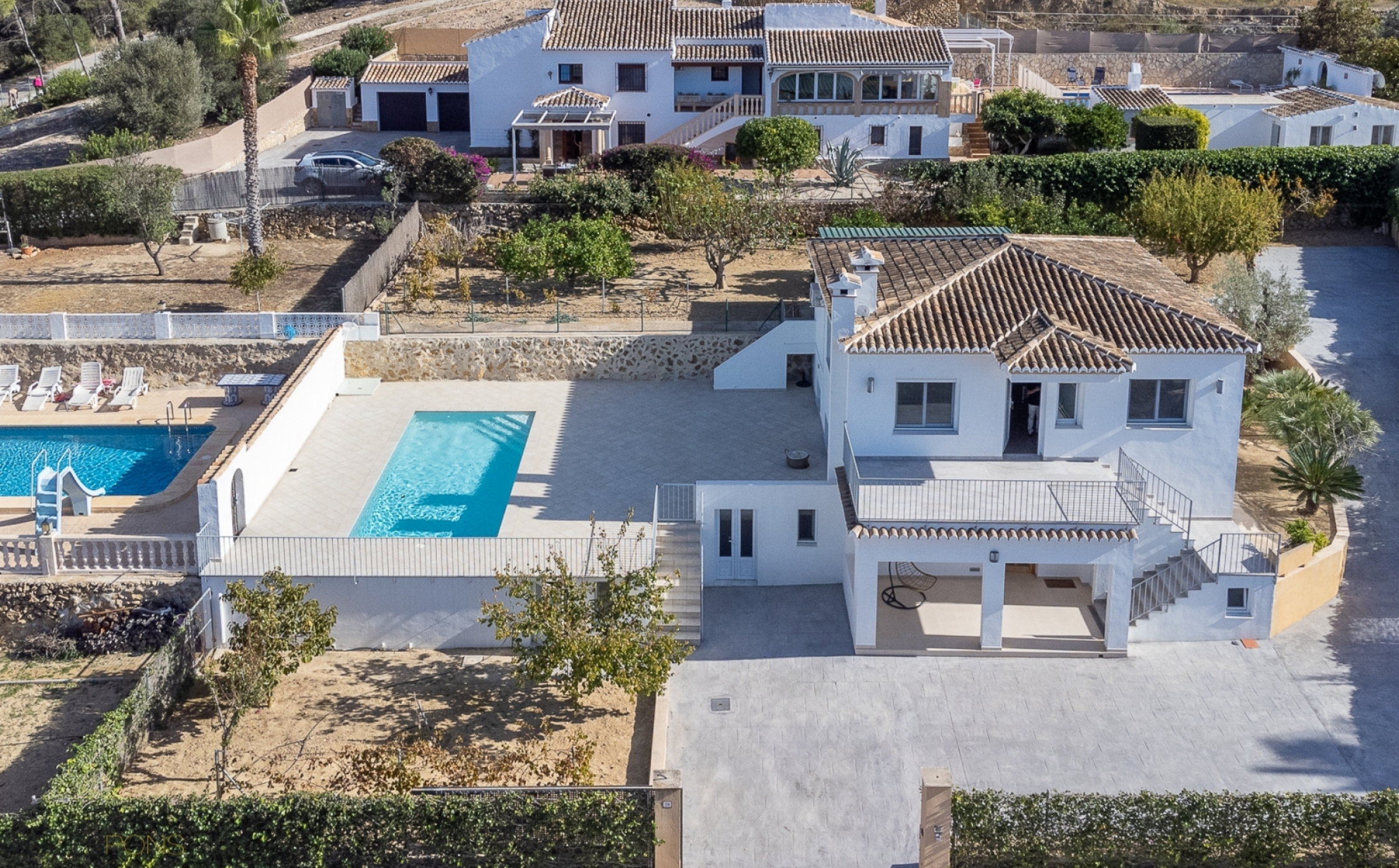
Chalet mediterráneo con piscina y vistas abiertas en Jávea PARTIDA COMUNES - ADSUBIA, JÁVEA/XÀBIA - REF. V-406