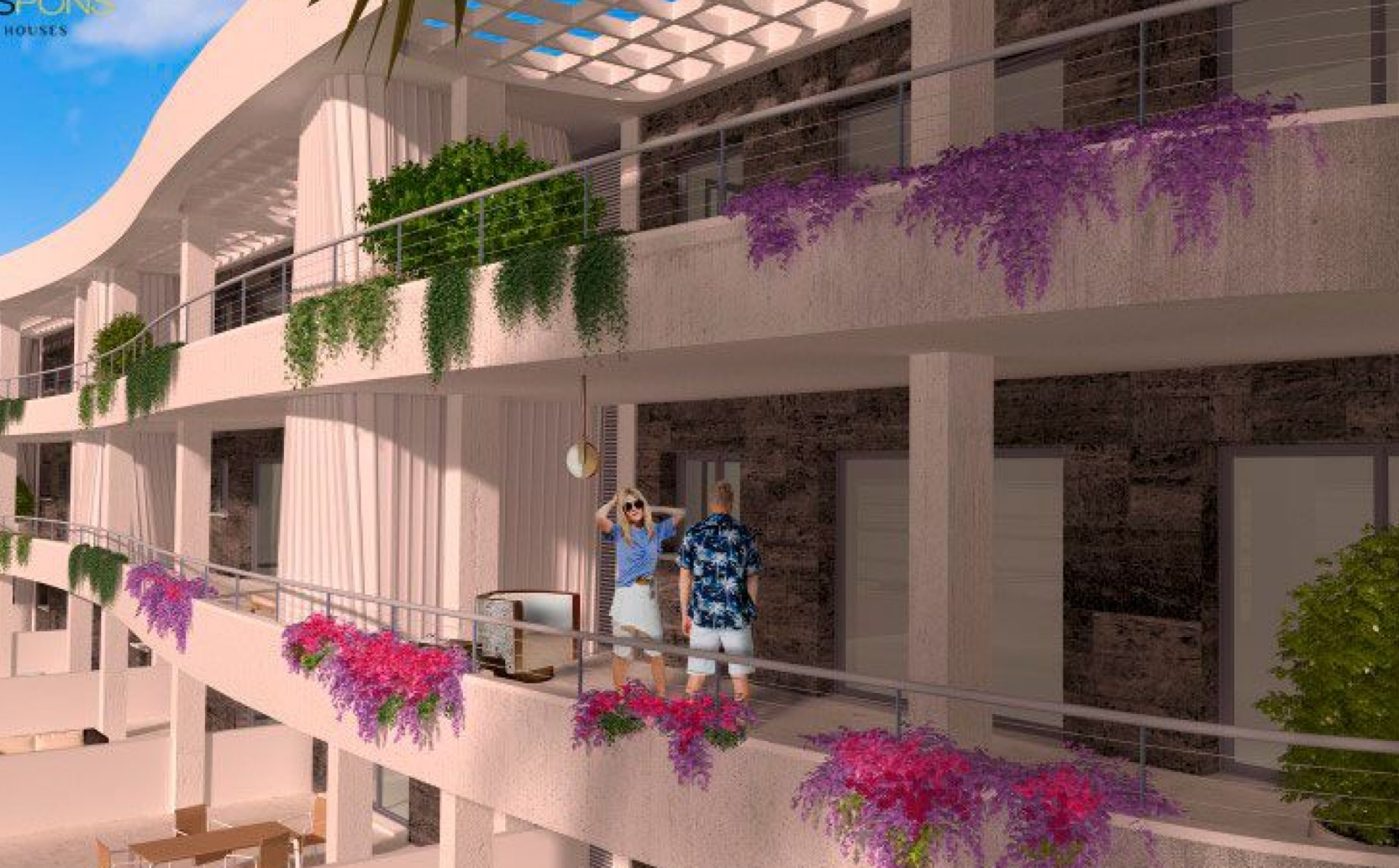
Planta baja con jardín en la playa del Arenal, Jávea. MONTAÑAR - EL ARENAL, JÁVEA/XÀBIA - REF. TERRAZAS BOB