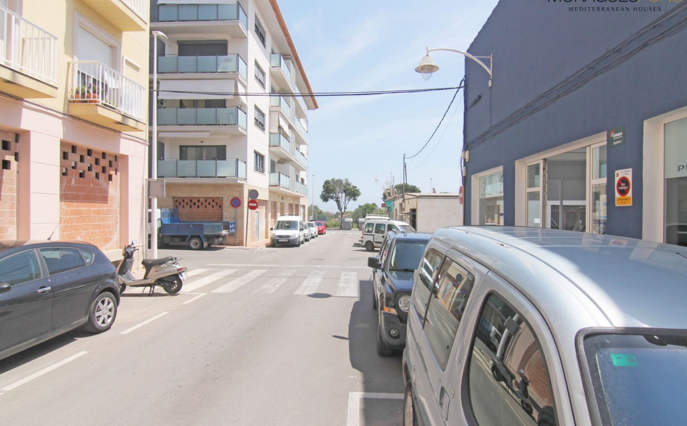
Plaza de parking en la Calle Sandoval CENTRO CIUDAD, JÁVEA/XÀBIA - REF. P-214